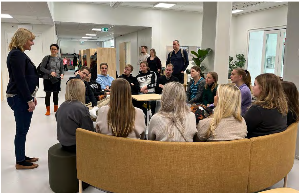
KUVA 1. REFLEKTIOHETKI SANNAISTEN KOULUN SYDÄMESSÄ

Viimeisten vuosien aikana on puhuttu paljon oppimisen immersioista, imusta, joka imee oppijat keskelle oppimista. Immersiosta puhutaan erityisesti pelillisyyden sekä digitaalisten ja virtuaalisten oppimisympäristöjen yhteydessä. Toisaalta jokaisen oppimisen tilan tulisi olla immersiiivinen. Niin myös demokratiakasvatuksessa. Tilojen puolesta niin Sannaisten koulu kuin Kemin kaupungintalo ovat molemmat ihanteellisia paikkoja demokratiakasvatukselle. Sannaisten koulun yhteisöllisyyttä korostava arkkitehtuuri on puitteiltaan ideaali paikka. Keskelle koulua rakennettu sydän on paitsi symboli myös konkreettinen paikka rakentaa yhteistä elämäntapaa kouluun. Kemin kaupungintalo puolestaan kohoaa kauas kaupungin kattojen yläpuolelle ja yhdeksännen kerroksen valtuustosalin ei jätä kävijäänsä kylmäksi. Valtuustosalissa on luonnollista asettua tutkailemaan demokratiaa, koska se on suunniteltu sitä varten.