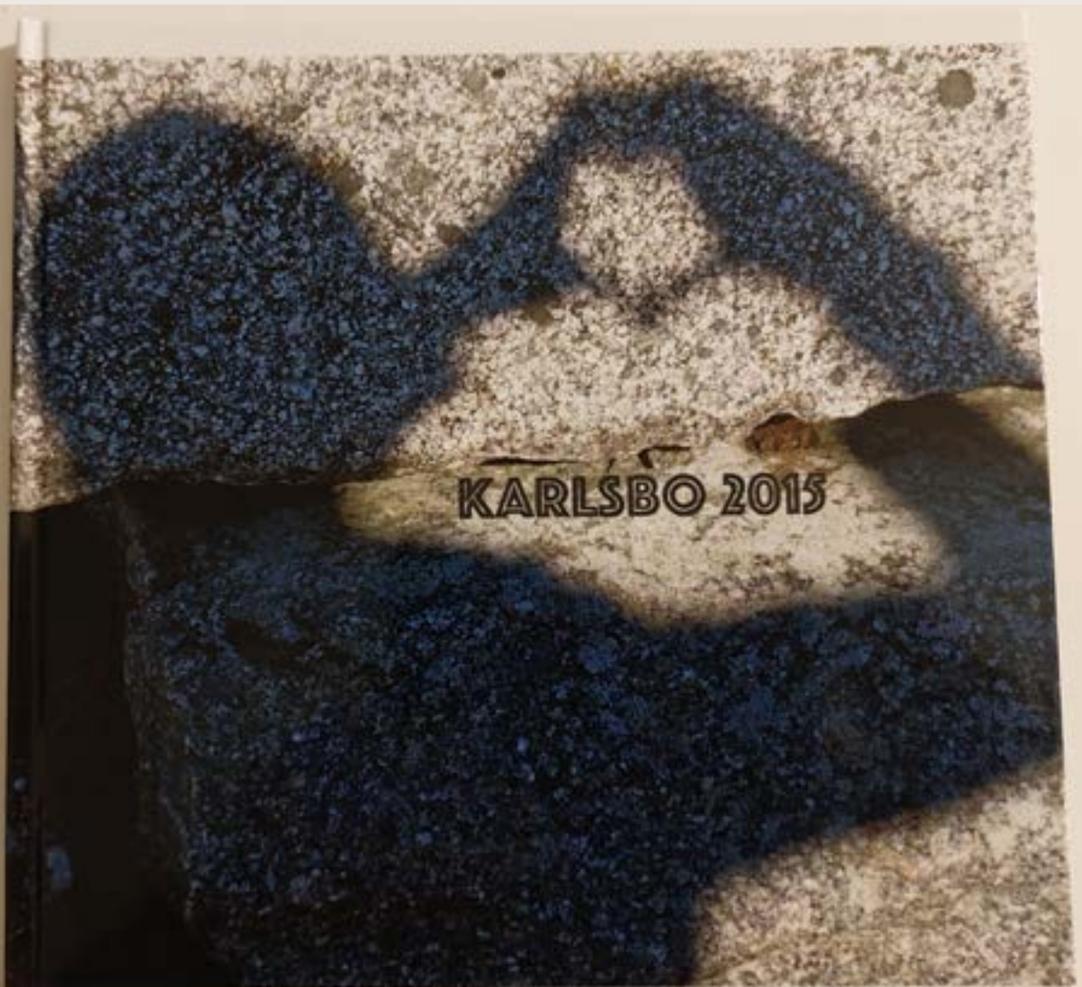
Kuva 1. Valokuva-albumin kansi.