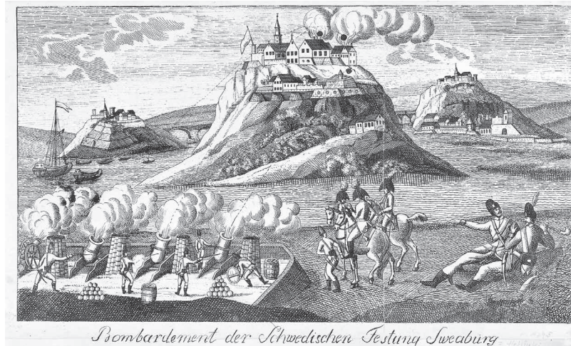
Viaporin pommitus 1808 ( Bombardement der Schwedischen Festung Sweaburg ). Tussipiirustus Suomenlinnan pommituksesta Suomen sodassa maalīs–huhtikuussa 1808. Vanhan Suomen seurankuntien saarnastuoleista luettiin vuosina 1808–1809 useita kuulutuksia, joissa määriltiin talonpojille sotaan liittyneitä velvoitteita.

1790-luvun alun suurten linnoitustöiden johtajana tunnetun generalissimus Aleksandr Vasiljevitš Suvorovin komentamien venäläis-itävaltalaisen joukkojen urotöistä Napoleonin armeijaa vastaan Italian Alpeilla vuonna 1799. Kuulutusten ohessa rukoukset, kuten syksyllä 1787 julistettu ”Rukous Turkin sodan alla”, keisarillisen armeijan menestyksen puolesta olivat toistuvia Vanhan Suomen seurakunnissa. 36