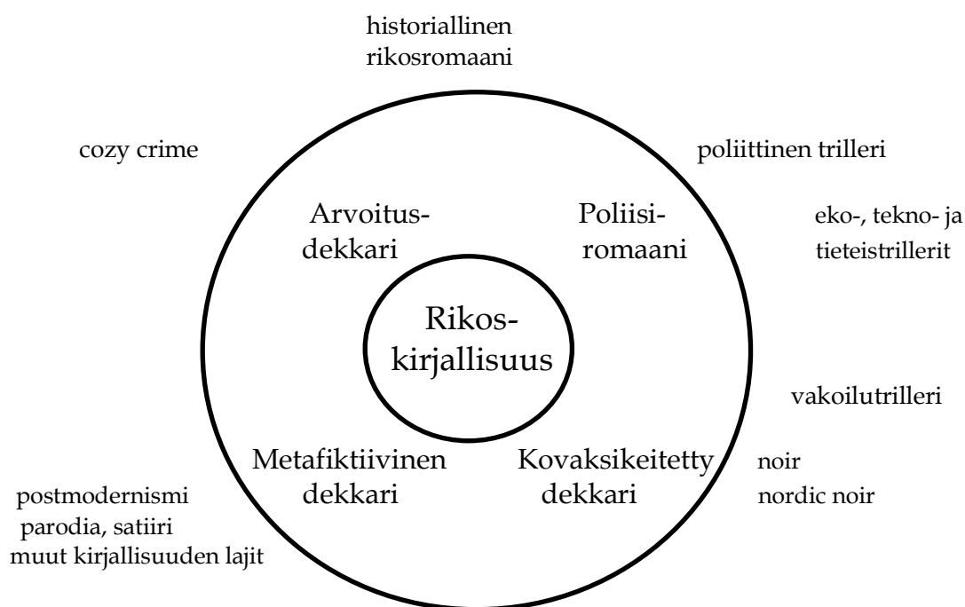
KUVIO 1 Rikoskirjallisuuden lajit ja niiden alagenret

Rikoskirjallisuutta kirjoitetaan ja luetaan paljon. Tämän takia kyseinen kirjallisuuden laji muuttuu kaiken aikaa. Kaavion kehät voisikin kuvitella liikkuviksi. Sisin kehä liikkuu hitaasti, toinen kehä nopeammin ja ulkokehä kaikista nopeimmin. Sinne voisi vielä lisätä vilkkuvia, tähtimäisiä alagenrejä, jotka joko jäävät taulukkoon pysyviksi tai osoittautuvat ajansaatossa tähdenlennoiksi.