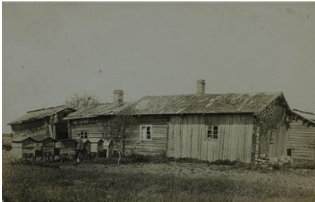
Noin 1780 perustettu Kulmalan torppa Loimaan Kauhanojankylässä 1920 kuvattuna.

Suomessa torpat, eli maanviljelyä ja asumista varten vuokralle annetut maatilan osat, olivat yleisiä erityisesti länsisuomalaisella maaseudulla. Suomen torpat olivat peruja Ruotsin valtakunnan lainsäädännöstä ja maankäytön käytännöistä. Autonomian ajalla torpparilaitos kehittyi Suomessa eri suuntaan kuin Ruotsissa. Ruotsissa torppien määrä väheni voimakkaasti 1800-luvun jälkipuolella. 1860-luvun 100 000 torpasta määrä putosi 30 000 torppaan vuoteen 1920 mennessä. Vuokramaan viljelemisestä ei muodostunut samalla tavoin yhteiskuntaa ravistelevaa kysymystä kuin Suomessa. Kehityskulkujen erot luovat mielenkiintoisen tarkastelukulman torpparilaitosta koskevaan historiankirjoitukseen. Jos kohdistetaan katse 1700-luvun puolivälistä sata vuotta eteenpäin, koko aikaväli voidaan nähdä sekä suomalaisilla että ruotsalaisilla alueilla torpparilaitoksen laajenemisen aikana. Miten tuon ajan torppia on käsitelty historiankirjoituksessa? Näkykö torpparilaitoksen erilainen päätyminen myös varhaisempaa torpparikautta kuvaavassa tutkimuksessa?