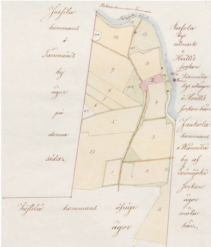
Saarikon torpan (tontti Z) pellot 1864 tehdyssä katselmuksessa Loimaan Tammiaistenkylässä. Peltojen raivaaminen oli aloitettu 45 vuotta aikaisemmin numeroilla 11 ja 5 merkityistä lohkoista. Kansallisarkisto, Maanmittaushallituksen uudistusarkisto.

Vakaata maata jalkojen alle olisi voinut vuokrasuhteidenkin osalta tarjota Edvard Gylling, mutta hän antaa vain pieniä vihjeitä keräämistään aineistosta. Aikaisemman opinnäytteensä (1907) Gylling teki Ikaalisten maatyöväen oloista, mikä ilmeisesti innoitti hänet kokoamaan Ylä-Satakunnan tuomiokirjoista vuosilta 1804–1809 torppien kontrahteja ja syyniasiakirjoja, joita kertyi ”hyvä joukko toista sataa”. Niihin nojaten Gylling kirjoittaa torpparitutkimuksessaan lyhyesti, että uudistorpparien avustamisen oli tavallista kaikenlaisilla tiloilla. Avustusmuotoina Gylling mainitsee vuokrasta vapaat vuodet, rakennusten luovuttamisen siirrettäväksi torpan rakennuskannan aluksi, mahdollisuuden viljellä tilan peltoa ensimmäisten vuosien ajan sekä viljalla ja karjalla avustamisen. Lisäksi Gylling kirjoittaa keräämistään kontrahdeista lyhyesti satakuntalaisessa kotiseutujulkaisussa (1907). Siinä Gylling kertoo esimerkiksi, että vuokraoikeuden ostaminen ja edelleen myyminen olivat yleisiä käytäntöjä ja että sopimus tehtiin usein määrävuosiksi, mutta lähtökohtaisesti määrääjän kuluttua uusittavaksi.