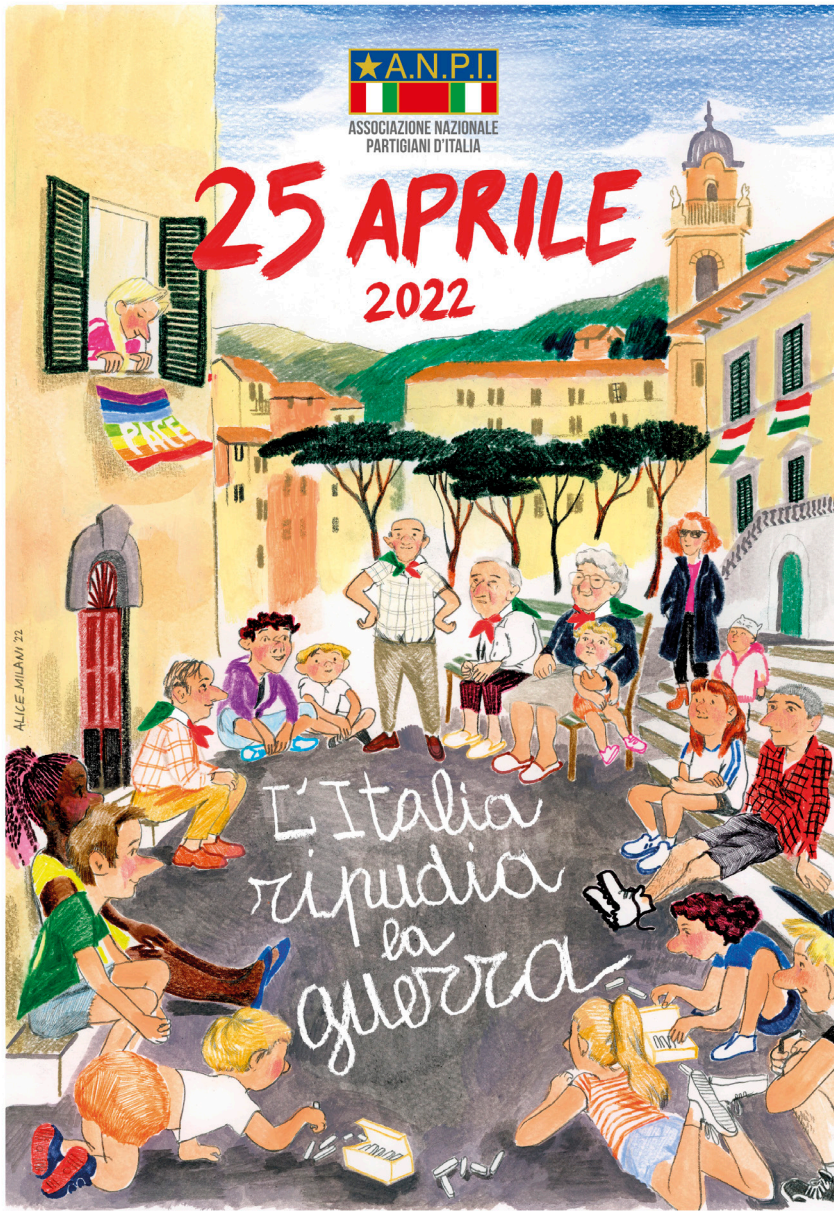
Kuva 1. Alice Milanin juliste. Milani on julkisesti pahoitellut kohua ja kertonut olleensa lippuja piirtäessään huolimatton. Lähde: ANPI/Alice Milani