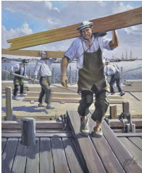
Lastin purkamista lotjasta lautatarhalle.