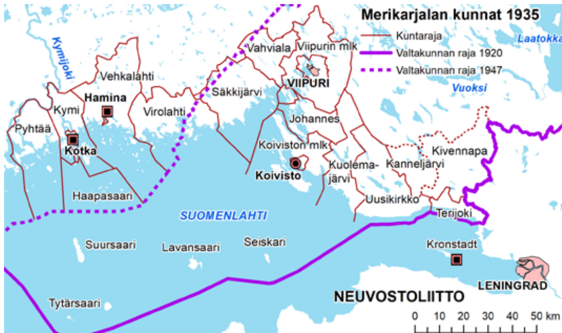
Merikarjalan 21 kuntaa 1930-luvun kuntarajojen mukaan. Karttaan on merkitty myös Uudestakirkosta vuonna 1925 erotettu Kanneljärvi sekä vuonna 1911 perustetun Terijoen emäkunta Kivennapa.

Rajajoelle (Siestarjoelle), jossa idän ja lännen valtapiirejä erotti jo Pähkinäsaa- ren rauhan raja (1323). Lännessä taas Kymijoelle (Pyhtäälle) hahmottui jo var- hain jonkinlainen heimo-, kulttuuri- ja murreraja. Keskiajalla Merikarjalan alue kuului laajassa Viipurin linnaläänissä neljän eri voutikunnan ("läänin", kihlakunnan) alaisuuteen, 44 ja eri kihlakuntien alueille seutu jakautui myös sen jälkeen, kun lääniraja oli vuoden 1634 läänituudistuksessa piirretty ensimmäistä kertaa Kymijoelle. 45