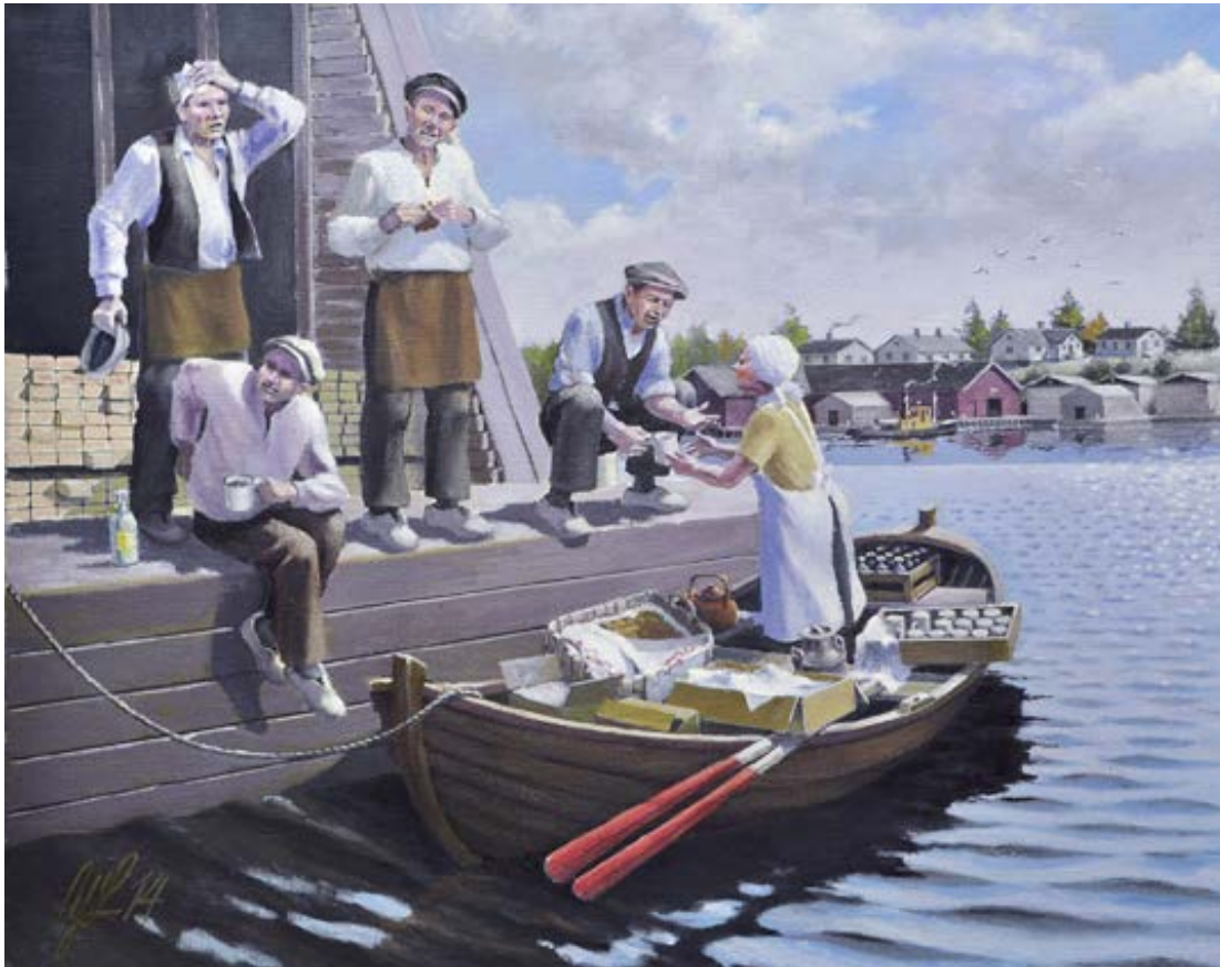
Taiteilija Yrjö Lohko on kuvannut maalauksessaan paattikauppiasta tärkeässä työssään.

lausuntopyynnöt Merikarjala-nimen käyttöönottamisesta. Molemmat suhtautuivat aloitteeseen myönteisesti. 21 Karjalan tutkimuslaitoksen lausunnossa todettiin uusien alueellisten nimitysten heijastavan tarvetta jäsentää maailmaa uudella tavalla. Toimijoita kannustettiin teettämään monialaista tieteellistä tutkimusta, joka tekisi Merikarjalaa tunnetuksi ja toisi nimitykselle merkityksellistä sisältöä. Tulosten toivottiin samalla havainnollistavan näkökulmia, jotka osoittavat uuden käsitteen tarpeellisuuden. Tämä vahvisti tarvetta koota ja analysoida tietoa seudun elämäntavasta ja kulttuurista; etenkin merenkulusta, kalastuksesta ja yleisesti merellisyydestä osana karjalaisten elämää. 22