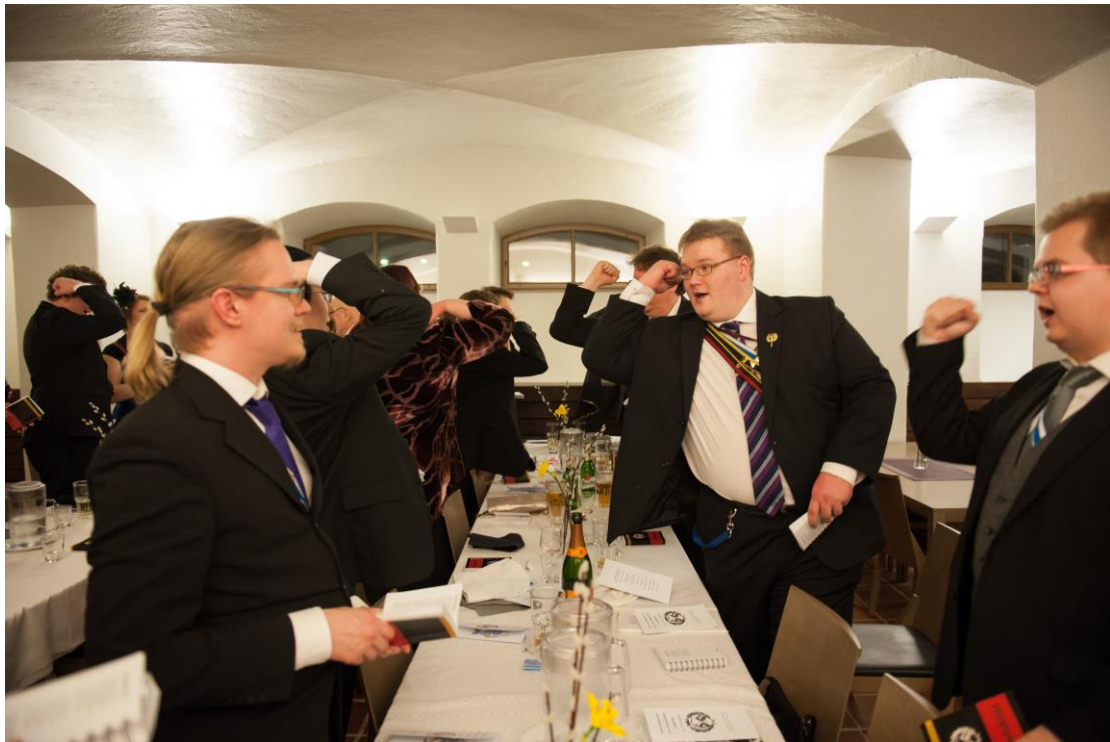
Kuva 1. Karjalaisten laulun yhteydessä nostetaan nyrkkiä kuten Karjalan vaakunassa. Kuva Savo-Karjalaisen osakunnan 89. vuosijuhlista 2014. Kuvaaja: Aake Kinnunen, kuvan käyttö sallittu vain tämän artikkelin yhteydessä.

Varsinkin kokemusta Karjalasta on tutkittu muistelun kautta, jolloin on todettu paikan näyttäytyvän erilaisena kokijasta riippuen (Fingerroos 2004). Toistuvien käytänteiden kautta osakuntalaisetkin tulevat hetkeksi osaksi maakunnan mielenmaisemaa (Korjonen-Kuusipuro & Kuusisto-Arponen 2017, 6). Maamme-kirjan aikaiset mielikuvat Savo-Karjalasta toistuvat niin haastatteluaineistossa kuin osakunnan KÄK-lehden artikkelissa, jossa etsittiin osakunnasta stereotyyppisiä savolaisia ja karjalaisia piirteitä (Agge 2014, 8). Savo-Karjalaisessa osakunnassa Karjala näyttäytyy etenkin Karjalaisten laulua laulettaessa. Viimeisessä säkeistössä "Karjalasta kajahtaa" -huudahduksen aikana nostetaan nyrkkiä kuten Karjalan vaakunassa ikään (Kuva 1). Eräs haastatelluista toteakin, että toisten maakuntalaulujen laulaminen elähdyttää enemmän kuin toisten (SKO8). Karelialismista ei tosin ole kyse, sillä laulujen lisäksi maakuntatuntemointi rajoittuu maakuntamatkailuun ja perinneruokiin. Toisin kuin Karjalan evakoiden kohdalla, kyse ei ole koetun muistelemista vaan mielikuvien Karjalan kokemista. Fingerroos (2004) nostaa Karjalan osaksi kansallista Suomimyyttiä. Hänen mukaansa siirtokarjalaisten utopioissa on kyse sekä unohduksesta että mielikuvien hämärtymisestä ja muuttumisesta. Ehkä vielä maakuntakerhojen aikaan ennen 1950-lukua maakunta-aate oli konkreettisempi, mutta nyt siihen sekoittuu paljon väkeviä mielikuvia, kuten juuri nyrkkiä heristävä taisteleva karjalainen.