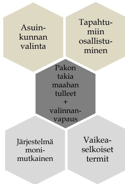
Kuvio 2: Maahan tulleiden valinnanvapauden toteutuminen

Tutkielman aineistosta löytyy hyvin vähän viittauksia valinnanvapauden toteutumiseen maahan tulleiden keskuudessa. Kuvioon 2 kokosin valinnanvapauteen liittyvät asiat. Alapuolelle on laitettu aineistosta löytyneet valinnanvapautta estävät asiat ja yläpuolelle missä valinnanvapaus maahan tulleiden kohdalla voi toteutua.