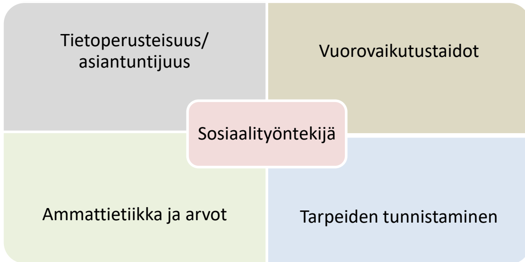
Kuvio 4: Sosiaalityöntekijän toimintaan vaikuttavat osa-alueet

Sosiaalityöntekijältä vaaditaan monialaista osaamista maahan tulleiden parissa tehtävässä työssä. Tutkielman aineiston kaikissa artikkeleissa käsiteltiin ammattilaisten osaamisen merkitystä maahan tulleiden tukemisessa. Aineiston perusteella sosiaalityöntekijän osaamisen voi jakaa neljään eri osa-alueeseen, kuten kuviossa 2 esitän: