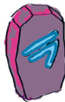
Rohkeus HALUAN KOKEILLA UUSIA ASIOITA