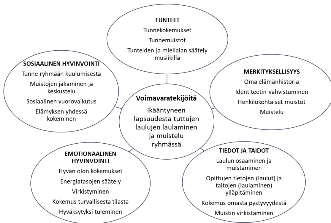
KUVIO 2. Lapsuudesta tuttujen laulujen laulamisen ja niiden pohjalta muistelemisen tarjoamia voimavaratekijöitä ryhmäkontekstissa (Kuvio: AT).

Kuviossa 2 on kiteytetty osallistujien kokemuksista ja kuvauksista nousseet voimavaratekijät, jotka mahdollistuivat näiden varhaisilta elinvuosilta tuttujen laulujen yhdessä laulamisen ja muistelun avulla ryhmäkontekstissa. Osallistujien kuvauksissa nousee selkeästi esiin, että jo varhain opitut ja osin myöhemminkin elämän varrella käytetyt laulut ovat heistä valtaosalle tärkeä osaa elämää vielä vanhuusiässä ja jo sitä kautta merkityksellisiä ja tärkeitä. Tutut laulut toivat mieleen