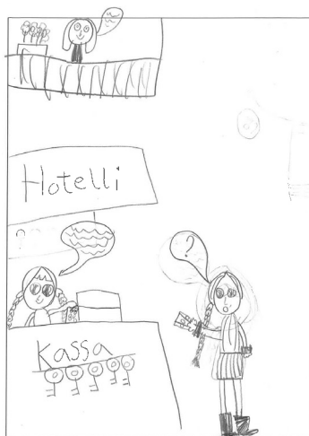
Kuva 1. Oppilaan piirtämä kuva, jossa käytetään useaa kieltä (ranskankielinen CLIL-luokka).

kuvuissa. Esimerkiksi Kuva 1 esittää oppilaan mukaan tilannetta, jossa henkilö nimeltä Nuppu on hotellin aulassa, missä hotellivirkailija puhuu hänelle espanjaa ja tuntematon henkilö parvekkeelta ruotsia. Nuppu ei ymmärrä kumpaakaan kieltä eikä näin ollen tiedä miten toimia. Tämä asetelma, jossa henkilöt käyttävät useampaa kieltä, mutta eivät ymmärrä toisiaan, oli varsin tyypillinen monikielisisissä kuvissa.