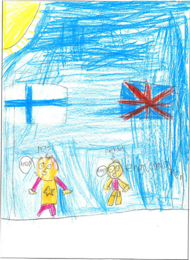
Kuva 5 (vasemmalla). Oppilaan kuva, jossa henkilöt juttelevat englanniksi (englanninkielinen CLIL-luokka).