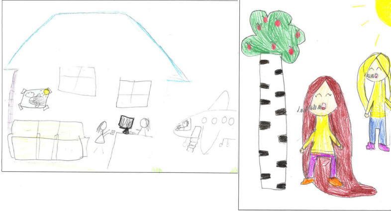
Kuva 2 (vasemmalla). Oppilaan piirros, jossa henkilö käyttää ranskaa, englantia ja ruotsia lentokentällä (ranskankielinen CLIL-luokka).