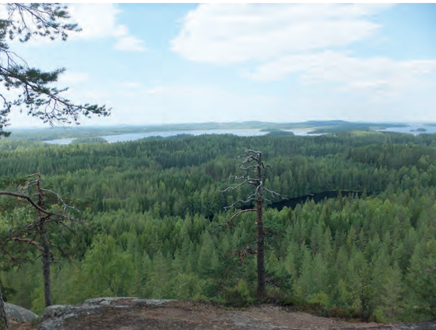
Kuva 1. Hyypäänvuori, Laukaa. KSU-raportti 2016.

käsittelyn yhteen konkreettiseen maisemakohteeseen; Keski-Suomen Laukaassa sijaitsevaan Hyypäänvuoreen. 1