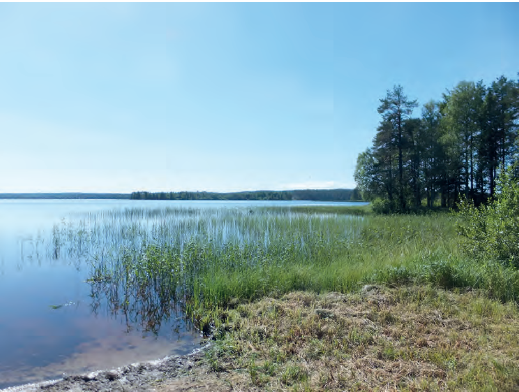
Kuva 11. Kynnämöinen

Maiseman avaruus, rauha, kelohonka, joka muistuttaa kuolemasta ja ikiajasta, kaukana häämöttävä vesistö, vesi, joka turvaa elämän, metsä ja kallio – suoja, kauneus...Maisema. (38)