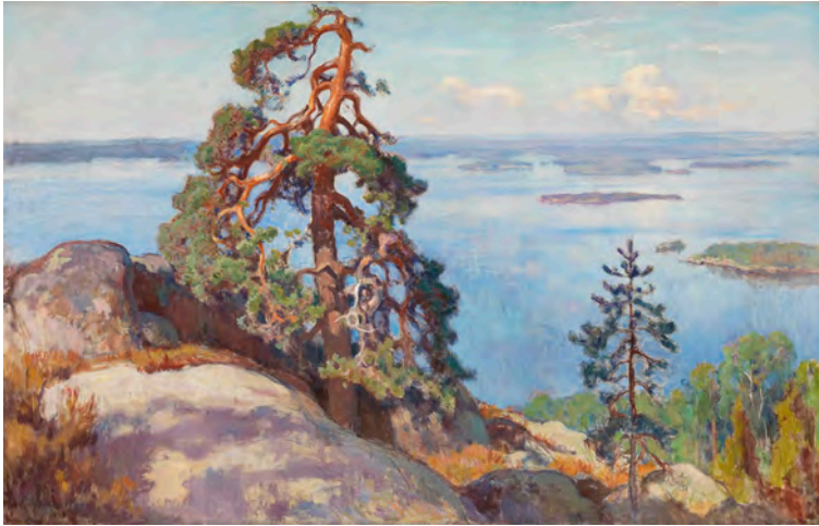
Kuva 2. Eero Järnefelt: Maisema Kolilta (1928). Öljy kankaalle, 125,5 × 196 cm. Suomen Säästöpankki Oy:n taidekokoelma, Kansallisgalleria/Ateneumin taidemuseo (Kuva: Kansallisgalleria / Joel Rosenberg).

kastelun erämaa-käsitteeseen, jota lähestyn erityisesti ekokriittisistä näkökulmista (esim. Coupe 2000; Snyder 2010; Garrard 2012; Hiltner 2015). Tässä kohtaa käytän aineistona myös luvussa ”Kysymyksiä luonnosta” esiteltyyn luontosuhdekyselyyn sisältyneen maisemakuvaosion vastauksia. Pyrin valaisemaan tutkimuskohteena olevaa Hyypäänvuoren maisemaa monipuolisesti ja avaamaan ymmärrystä siitä, miten maiseman kaltaiset kulttuuriset konstruktiot muuttuvat ihmisille todeksi kytkeytymällä tapoihin hahmottaa ja arvottaa ympäristöä. Tätä kautta maisemat vaikuttavat myös ihmisten luontosuhteisiin ja -yhteyksiin.