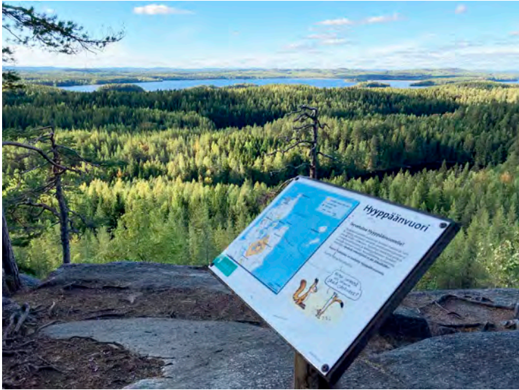
Kuva 8. Infokyltti Hyppäänvuoren laella.

mat vastaavanlaisen näkymän esitykset järnefelteistä gallen-kal-leloihin ja jonka osaksi maiseman katselija voi itsensä tuntea. Kansakuntaa määrittävät myyttiset maisemat ylittävät ajan ja paikan ja rakentavat vaivihkaa siteitä, jotka ikään kuin kietovat ihmisiä menneisyyteen. (Anderson 2007; Schwarz 1986, 155; Hall 2019, 117.)