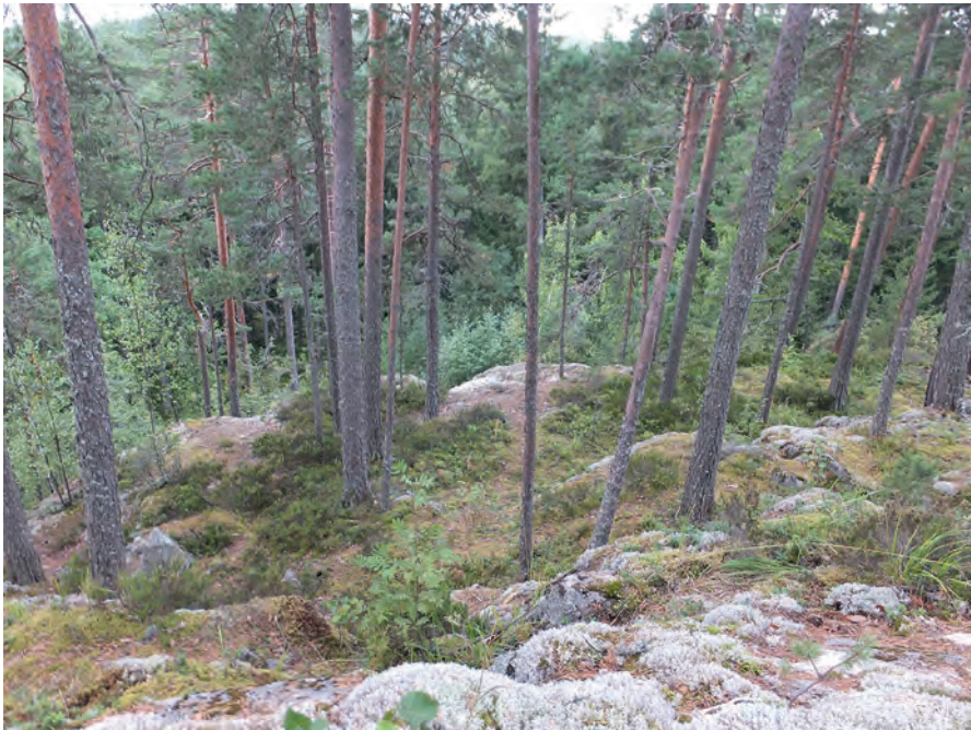
Kuva 10. Kuhmoisten linnavuori (Kuva: Katriina Koski).

Vastaajien tehtävänä oli valita esimerkkikuvista kolme heitä eniten miellyttänettä maisemaa, asettaa ne paremmuusjärjestykseen sekä perustella vastaukset ja kertoa puuttuiko kuvista jokin heille erityisen tärkeä maisematyyppi tai -kohde. Eniten valintoja saavutti Hyyppäänvuori, jonka kuvana oli samainen otos, jonka olen jo esitellyt aikaisemmin tässä luvussa (ks. kuva 1). Se keräsi kaikkiaan 36 valintaa 8 , joiden joukossa oli selkeästi eniten yksösrunkauksia. Toiseksi eniten valintoja, 26 kappaletta 9 , sai Kuh-