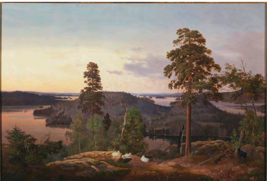
Kuva 4. Ferdinand von Wright: Näköala Haminalahdelta (1853). Öljy kankaalle, 88 cm x 131 cm. Kansallisgalleria / Ateneumin taidemuseo.