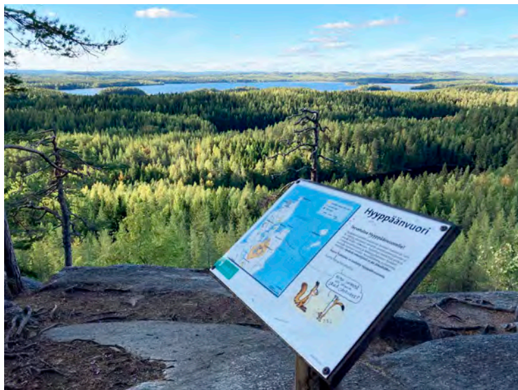
Kuva 8. Infokyltti Hyppäänvuoren laella (Kuva: Antti Vallius).

mat vastaavanlaisen näkymän esitykset järnefelteistä gallen-kal-leloihin ja jonka osaksi maiseman katselija voi itsensä tuntea. Kansakuntaa määrittävät myyttiset maisemat ylittävät ajan ja paikan ja rakentavat vaivihkaa siteitä, jotka ikään kuin kietovat ihmisiä menneisyyteen. (Anderson 2007; Schwarz 1986, 155; Hall 2019, 117.)