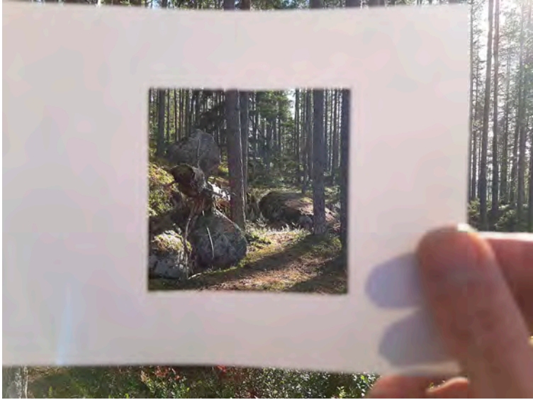
Kuva 13. Rajattu metsänäkymä.