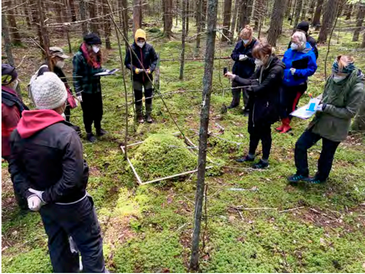
Kuva 2. Tutkimusruutukartoituksen purkua sammalvaltaisella ruudulla. Ruutujen lajistot ja etenkin lajien runsaussuhteet olivat hyvin erilaisia (ks. kuvat 3 ja 4), vaikka ruudut sijaitsivat vain parinkymmenen metrin päässä toisistaan.

pajan ekologeilta. Mikäli osallistujat tai me tutkijat emme osanneet määrittää lajia, havainto kirjattiin ylös ryhmän tarkkuudella (esim. ”sammal 1, sammal 2”). Tehtävän tavoitteena oli havainnollistaa lajiston monimuotoisuuden mittareita, eli lajimäärää ja lajienvälistä runsautta, sekä satunnaisuuden merkitystä havaitun lajiston koostumukselle. Tehtävän lopuksi keräännymme koko joukolla jokaisen ruudun ääreen, missä kukin kartoittajapari esitteli ruutunsa runsaimman sekä omasta mielestään mielenkiintoisimman lajin.