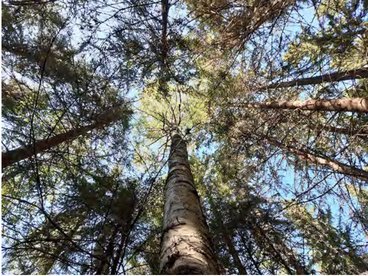
Kuva 18. Koivun ( Betula sp.) ja kuusten ( Picea abies ) latvuksia.

Vaikka se sitten on nimenomaan se visuaalinen kuva, et jos näyttää nätille, niin se on ihmisen mielestä tämmöstä niinku jollakin lailla miellyttävää, se on ok, et se niinku riittää. Ja jonkun tien varrella, musta ainakin tuntuu, että tien varrelle jätetään semmoset tupsut mehtää ja siten muualta sieltä kauempaa voidaan laittaa kaikki matalaksi, kun eihän sillä ole mitään väliä. Että miltä se näyttää siitä, mistä ihmiset pääsääntöisesti kulkee, niin sillä muka ois väliä. Eikä aatella sitä, että ehkä se mehtä on jollekin muullekin tärkeä kuin sille sellutehtailijalle, että sillä on jotakin muuta funktiota muille eliöille, mutta myöskin sitten se, että kyllä se vaikuttaa varmaan meihin ihmisiinkin monilla semmoisillakin tavoilla, mitä ei vielä oo osattu tutkia, että sitä mehtää on olemassa. (Työpajakeskustelu 14.9., 11)