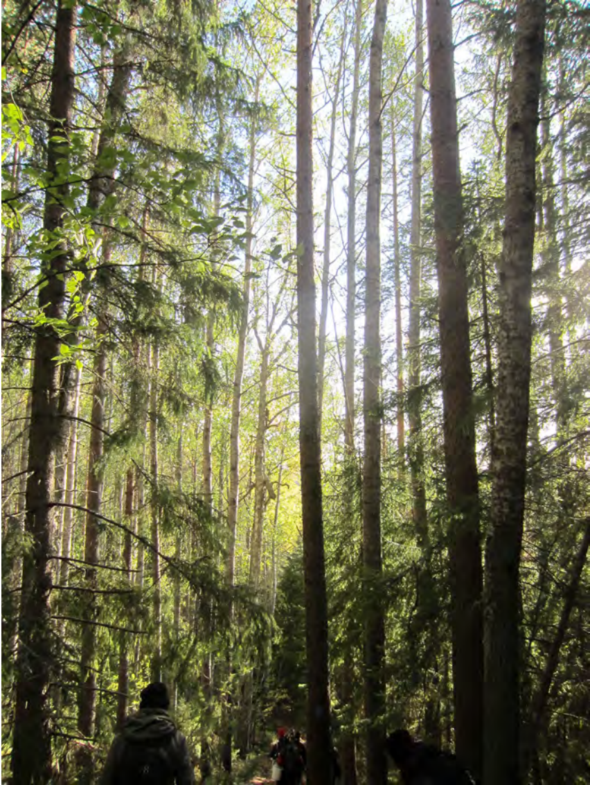
Kuva 19. Metsää ja ihmisiä ( Homo sapiens ) polun varrelta.