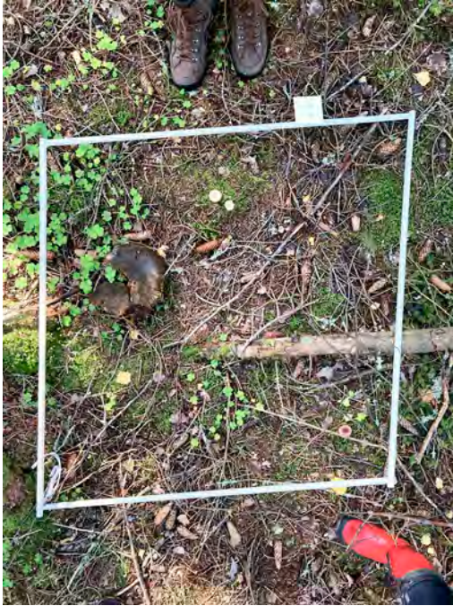
Kuva 3. Tältä tutkimusruudulta löytyi paljon sieniä: mustarousku ( Lactarius turpis ), lakkinupikka ( Cudonia confusa ), haperolaji ( Russula sp.), keltasarvikka ( Calocera viscosa ), malikkalaji ( Clitocybe sp.), kuusenneulasnahikas ( Marasmiellus perforans ), jänönkorvalaji ( Otidea sp.), hiippolaji ( Mycena sp.) ja seitikkilaji ( Cortinarius sp.).

Eniten peittävä laji on sitten tämä kerrossammal. Ja näitä kuusenneulasnahikkaita laskimme noin kahdeksankymmentä. (Työpajakeskustelu 15.9., 12)