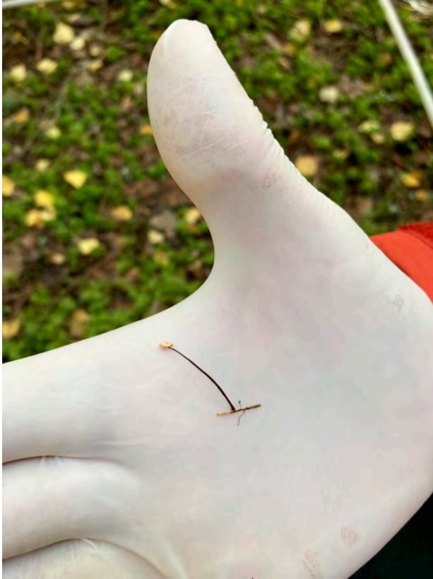
Kuva 5. Kuusenneulasessa kasvavaa vaalealakkista kuusenneulasnahikasta ( Marasmiellus perforans ) löytyi paikoitellen runsaasti.