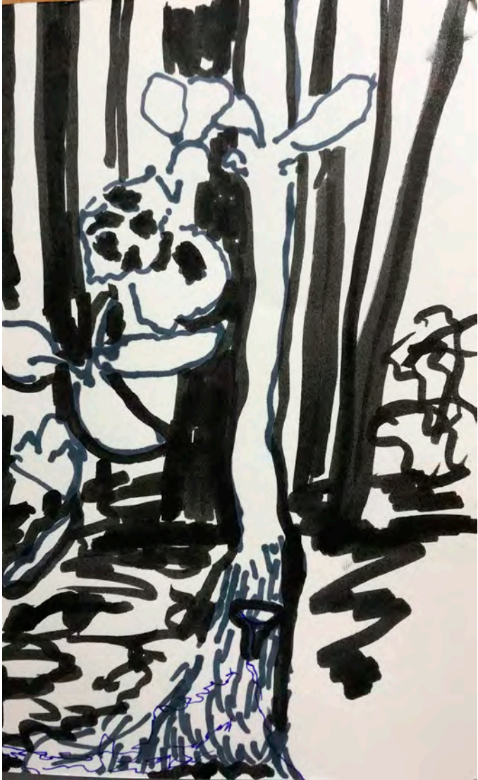
Kuva 8. Osallistujan piirtämä kuva aistiharjoituksen aikana. (Kuva: osallistuja 37)