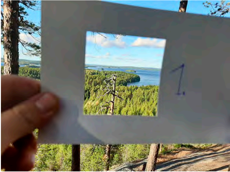
Kuva 12. Paspistehtävässä kehystetty Hyypäänvuoren korkealta avautuva järvimaisema.

Ihminen voi antaa luonnolle merkityksiä ja arvottaa sitä (tai olla arvottomatta) hyvin monesta eri vinkkelistä, ja jokainen eri vinkkeli voisi tarkoittaa erilaisia käytäntöjä esimerkiksi metsän ”hoidon” suhteen. (Palautekysely, 16)