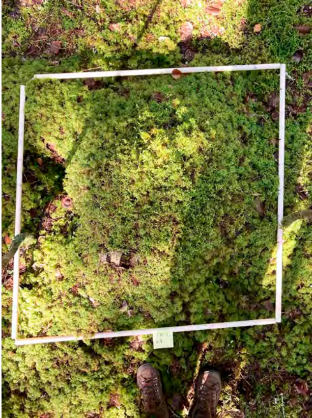
Kuva 4. Seinä- ja kerrossammal ( Pleurozium schreberi , Hylocomium splendens ) vallitsivat tällä tutkimusruudulla.

oli mustikkaa, käenkaalia ja kahta erilaista tuommosta jotakin heinää. Ja sitten oli vanamoja ja oravanmarjaa. (Työpajakeskustelu 14.9., 1 ja 11 työparina)