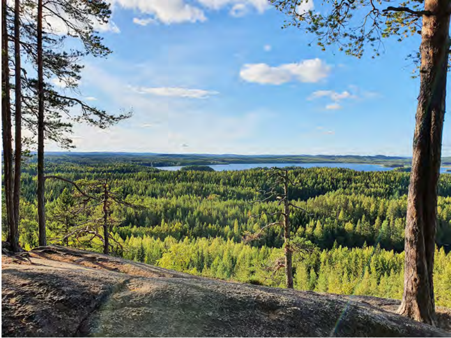
Kuva 16. Korkealta Hyypäänvuoren laelta avautuva järvimaisema.

muodostumiseen sekä sitä, miten poliittisesti latautuneita tämän kaltaiset maisemakuvastot voivat olla. Lisäksi tietoisun tarkoituksena oli nivoa yhteen työpajassa käsitellyjä teemoja ja toimia yhteisen loppukeskustelun kimmokkeena.