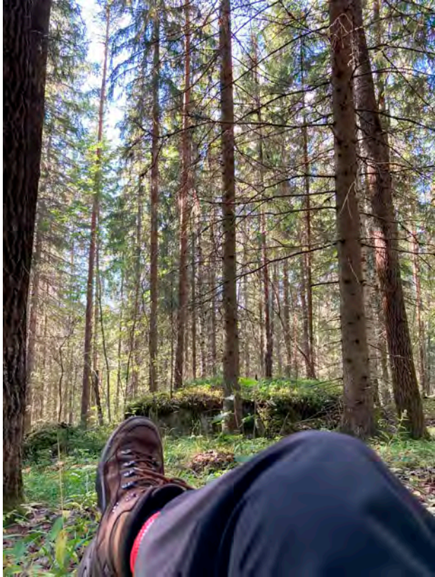
Kuva 7. Aistiharjoituksessa osallistujat saivat vain olla valitsemassaan paikassa ja keskittyä aistimaan ympäristöä.

sä kun on metsässä yksin, ja jos joku tulee, niin siihen joutuu reagoimaan eri tavalla, kun se on joku muu ja ei tiedä, et onko koiraa mukana ja mitä tapahtuu. Kun tietää, et se oot juuri sinä, joka tulet, et mun ei tarvinnu reagoida mihinkään. Ja sit se tuntuu hyvältä, et sä näet mut siinä mun paikalla ja mä saan olla rauhassa. Ja sit sä sanot, että älä säikähdä. Must se on ihana, se oli hyvä. (Työpajakeskustelu 15.9., 12)