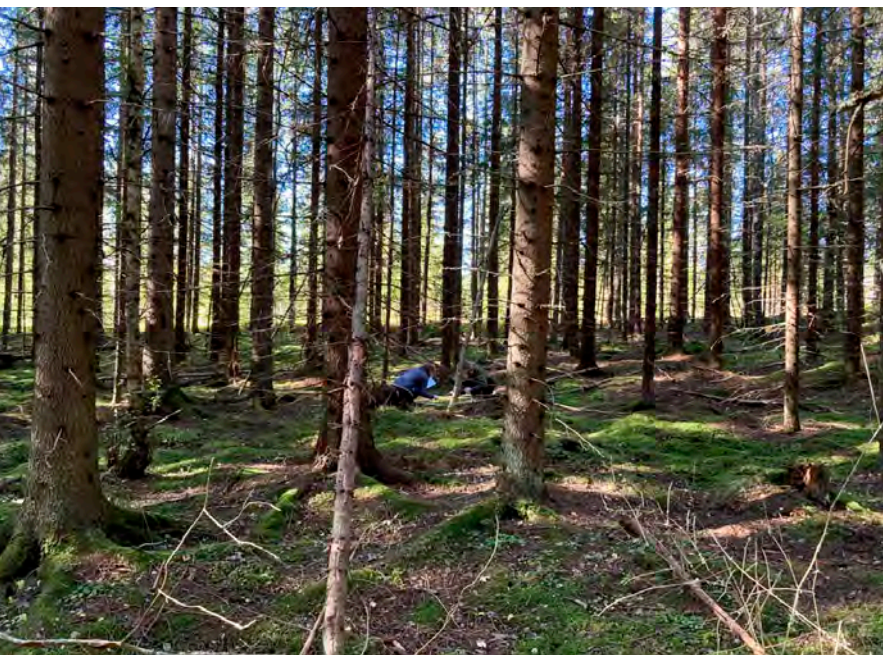
Kuva 1. Osallistujia syventyneenä tutkimusruutuunsa. Tutkimusruuturasti sijoittui talusmetsään, jossa oli olematon pensaskerros ja niukka kenttäkerros. Pohjakerroksesta löytyi sammalia ja sieniä.

Ensimmäisellä rastilla sovelsimme muun muassa kasvilajiston monimuotoisuusselvityksissä yleisesti käytettävää tutkimusruutukartoitusmenetelmää (RajatOn 2015), jonka avulla osallistujat laskivat pareittain satunnaisesti sijoitetulta neliömetriruudulta kaikki sammal-, putkilokasvi- ja sienilajit (kuva 1). Kasveista tuli arvioida lajien peittävyudet prosentteina tutkimusruudun pinta-alasta ja sienistä itiöemien tarkat lukumäärät 2 . Tietojen tallentamista varten jaoimme osallistujille valmiit lomakkeet. Tehtävässä ei vaadittu kuitenkaan lajintunnistustaitoja, vaan tunnistukseen sai tukea työ-