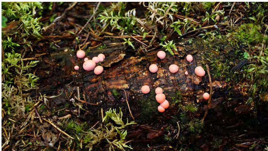
Kuva 17. Limasieni sudenmaito ( Lycogala epidendrum ) ja kiiltomato ( Lampyris noctiluca ) sammaleisella puunrungolla. (Kuva: osallistuja 5)

Mittakaavaan liittyvistä seikoista keskustelu eteni muun muassa erilaisiin maisemointitoimiin, jotka saavat muotonsa ja voimansa vallitsevista maisemakäsityksistä. Näissä tapauksissa yleisesti kauriiksi ja hyviksi miellettyjä maisemia käytetään ikään kuin katseen kestävinä lavasteina, joiden takaiseen ympäristöön voi kohdistaa voimakastakin ja pääsääntöisesti taloudelliseen hyötymiseen tähtäävää muokkausta.