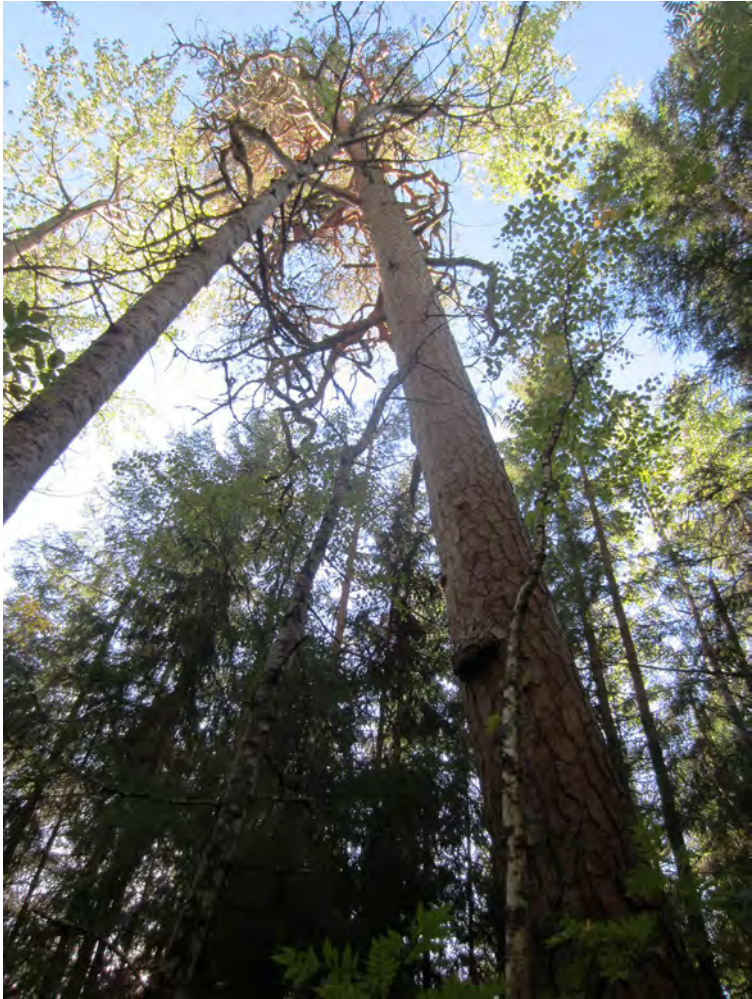
Kuva 9. Polun varrella kohdattu vanha mänty ( Pinus sylvestris ). (Kuva: osallistuja 11)