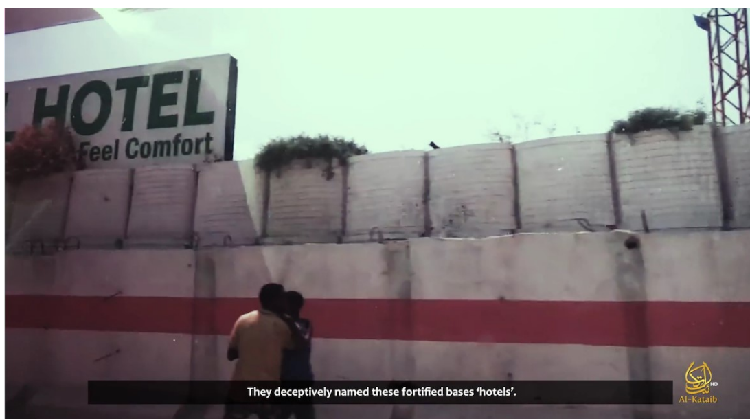
Kuva 3 (Al-Kataib Media center. Then fight the liederes of disbelief)

Myös itsemurhapommittajia verrataan täsmäaseisiin, jotka valitsevat kohteensa tarkasti ja suunnitelmallisesti. Siinä missä Yhdysvaltoja ja sen liittolaisia syytetään siviilien pommittamisesta, niin oma toiminta pyritään myös tältä osin muotoilemaan suunnitelmalliseksi sotilaskohteiden tuhoamiseksi. Väitettä perustellaan vielä lainaamalla länsimaisten asiantuntijoiden kommentteja, kuten yhdysvaltalaisen terrorismin tutkija David Kilcullenin näkemyksiä. Vastuullisuuden korostaminen luo turvallisuuden tunnetta ja samalla se toimii yhtenä olennaisena suostuttelun välineenä, johon tavallisten ihmisten on helppo odottaa identifioitua. Lisäksi tuomalla ilmi iskuihin liittyvää tiedustelutoimintaa, pyritään luomaan kuva organisoidusta ja tarkasta iskujen suunnittelusta. Tällä suunnittelulla väitetysti myös pyritään vähentämään ulkopuolisiin kohdistuvia oheisvahinkoja. Samalla pyritään vahvistamaan mielikuvaa toimijasta, joka pyrkii ottamaan huomioon siviilit sodan keskellä.