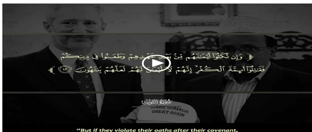
Kuva 4. (Al-Kataib Media center. Then fight the leaders of disbelief)

Se mitä islamilainen toiminta käytännössä on, niin se on jätetty määrittelemättä tarkemmin, pois lukien yleinen viittaus Sharia-lain toteutumattomuuteen nykyisen hallinnon vaikutuksen alla. Tavalliset kansalaiset on alistettu virallisen hallituksen vallan alle, millä myös perustellaan tarve kansa vapauttamiselle uskonluopioiden kahleista. Aineistossa somalialaiset poliitikot identifioidaan myös erilaisilla visuaalisilla mielleyhtymillä länsimaisiin vihollistoimijoihin. Yhdessä esimerkissä viitataan Yhdysvaltain presidentin Donald Trumpin vaalisloganiin, mikä tosin on muunnettu muotoon "Make Somalia great again". Tällaisilla voimakkailla mielleyhtymillä pyritään luomaan selviä yhteyksiä eri vihollistoimijoiden yhteisten pyrkimysten välille. Tässä tapauksessa materiaali nostaa esiin Yhdysvaltojen poliittisen toiminnan yhdistämisen Somalian sisäisiin asioihin, jolla on pyritty liittämään paikallishallinto mielikuvien tasolla entistä lähemmäksi toista vihollisosapuolta, eli Yhdysvaltoja. Tässä tulee esille intertekstuaalisuus, jolloin viitataan historiassa aikaisemmin käytettyihin ilmaisuihin, jotka on nyt muokattu palvelemaan omia etuja. Ilmaisujen käyttäminen on suhteessa aina muihin ja aiempiin käyttötilanteisiin (Pynnönen 2013 14). Somalian hallitus identifioidaan ei islamilaiseksi, joten se on asia mistä tulisi erottautua hinnalla millä hyvänsä.