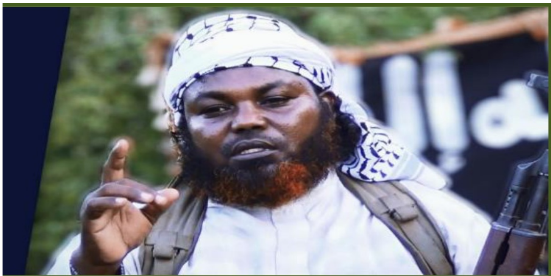
Kuva 1 (Al-Kataib Media center. Then fight the leaders of disbelief)

Visuaalisesti uskonnollinen identifikaatio nousee esiin myös siinä, että vastustaja kuvataan maallisesta näkökulmasta esim. pukeutumisen kautta, kun taas järjestön äänenä toimivat henkilöt omaavat traditionaalisemman ulkoasun. Hallinto näytetään sekulaarimmasta näkökulmasta, mikä avaa heti erilaisia miellelyhtymiä verrattuna uskonnollisempaan ulkoasuun. Tässä on myös hyvä muistaa kohdeyleisön konteksti, joka on todennäköisesti köyhä maalaisväestön edustaja tai länsimaisessa yhteiskunnassa itsensä vieraaksi kokeva maahanmuuttaja henkilö. Perinteinen ulkoasu auttaa luomaan mielikuvaa siitä, että ollaan yhtä paikallisten kansan kanssa, kun taas länsimaisesti pukeutuneet hallituksen pukumiehet edustavat jotain vierasta. Visuaalisuuden kautta tässä tapauksessa vahvistetaan lisää me ja muut näkökulmaa. Seuraava kuva osoittaa, kuinka Al-Shabaab luo mielikuvia traditionaalisemmalla olemuksellaan ja näin ollen pyrkii asettumaan tavallisten kansalaisten tasolle.