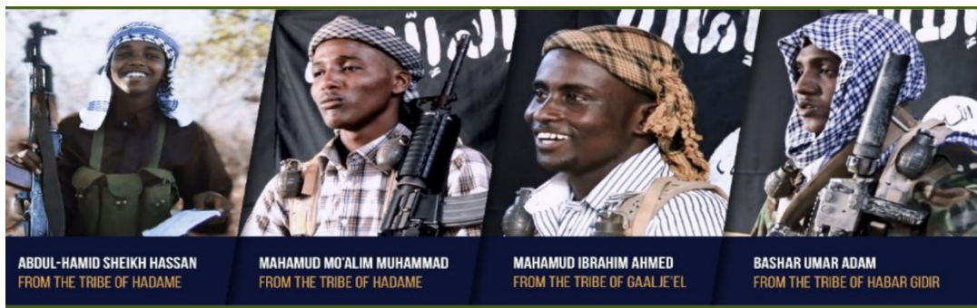
Kuva 2 (Al-Kataib Media center. Then fight the liederes of disbelief)

Toisaalta tässä tulee myös esiin Burken (Summa 1996, 59) mainitsema identifikaation salakavaluus. Identifioimalla somalialaiset ikään kuin valmiiksi Al-Shabaabin puolelle, luodaan jo retoriikan tasolla ennakkoasetelma, jossa kaikki kuuluvat jo valmiiksi joukkoon, mikä voi luoda ihmisille vahvoja tiedostamattomia mielikuvia. Burken yhtenä tavoitteena oli osoittaa, että voimme nähdä retoriikan taakse, mikäli pystymme identifioimaan erilaiset symbolit oikealla tavalla (Puro 2006, 128). Tässä tapauksessa näyttää sille, että Al-Shabaab pyrkii todella inklusiiviseen lähestymiseen. Se rakentaa viestinsä siten, että se näyttäytyy kaikille kutsuvana, joten siihen on mahdollista identifioitua taustoista huolimatta. Somalian klaaneista johtuvassa hajanaisessa ympäristössä tämä on ollut haastavaa, mikä on myös ollut haasteena koko valtion yhtenäisyydelle.