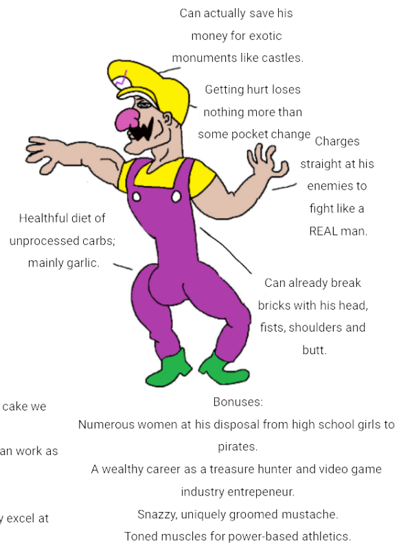
Kuva 2: Esimerkki Virgin vs Chad -kuvamakrosta.

Vandelanotte (2021) kuvaa esimerkinomaisesti myös uudempia kuvamakroja ja konstruktioita, kuten erilaisia Me / Also me -tekstirakenteita (kuva 3), jossa ensimmäinen lause kertoo jotain puhujasta, ja toinen lause on näennäisessä ristiriidassa ensimmäisen lauseen kanssa. Vandelanotte (2021, s. 184) argumentoi myös näiden tekstiraken-