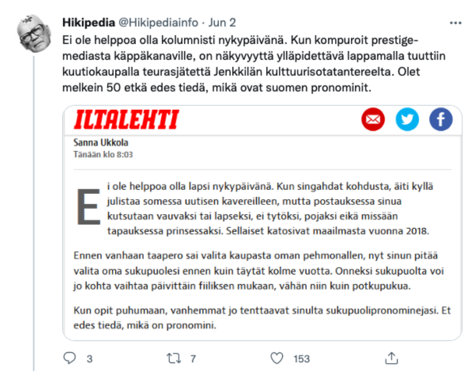
Kuva 4: Aineisto, twiitti 16

Lisäksi @hikipediainfo syyttää twiiteissään Ukkolaa suorasta ja mahdollisesti tietoisesta valehtelusta. Tämä yhdistettynä edellä mainittuihin huomioihin vahvistaa laajempaa diskurssia, jossa Ukkolan ammattitaito kyseenalaistetaan. Kolumnia parodioivaan twiittiin kytkeytyy useampia vastauksia, joissa @hikipediainfo jatkaa kritiikkiään. Ensimmäisessä vastauksessa kiitellään sarkastisesti Ukkolan integriteettiä, kun paljastetaan tämän kolumneissa olevan lähdelinkkejä, "joita klikkailemalla voi yleensä pelkän otsikon perusteella selvittää hänen valehtelevan" (Aineisto, twiitti 17).