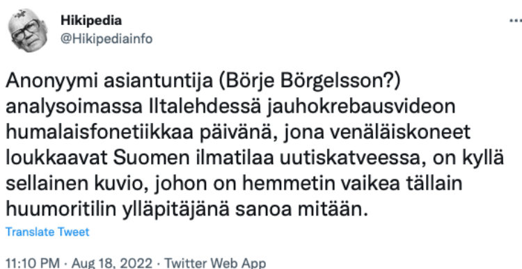
Kuva 1: Aineisto, twiitti 24

Samana iltana Twitterissä julkaistiin seuraava twiitti: