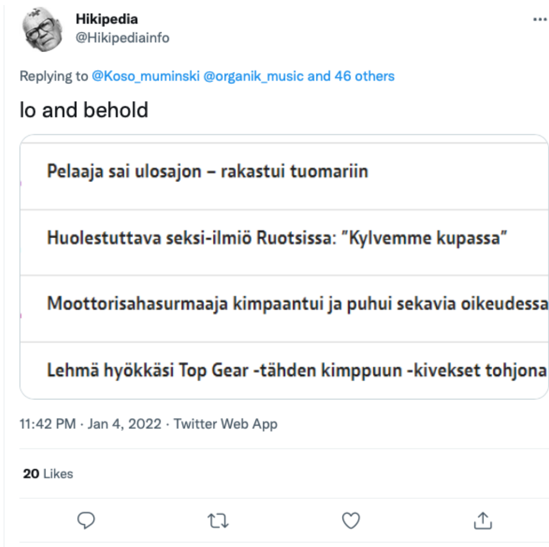
Kuva 6: Aineisto, twiitti 1.

Hikipedia kritisoi twiiteissään myös pääministeri Sanna Marinin jauhojengi-kohun yhteydessä Iltalehden julkaisemaa uutista, jota varten nimettömänä pysyttelevä äänitekniikan asiantuntija oli tehnyt spektrianalyysin jauhojengi-huudosta. Twiitit luovat diskurssia, jossa anonymiteetin myöntäminen kyseiselle äänitekniikan asiantuntijalle oli poikkeuksellista ja epäeettistä. Lisäksi Iltalehti esitetään Julkisen sanan neuvoston Journalistin ohjeista piittaamattomana medianä, käyttäen esimerkkinä nimenomaan kyseisen anonymiteetin myöntämistä.