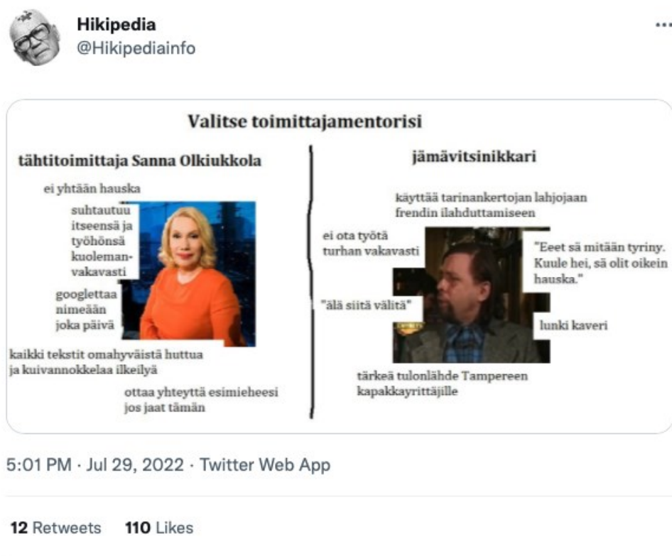
Kuva 5: Aineisto, twiitti 23