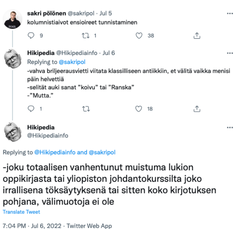
Kuva 7: Aineisto, twiitit 21 (keskimmäinen twiitti) ja 22 (alimmainen twiitti).

Toinen kolumneihin liittyvä diskurssi on osittain etuoikeutettujen kolumnistien diskurssin kanssa päällekkäinen. Normikriittinen, kolumnien aihevalintoja kritisoiva diskurssi implikoi, että kyseiset kolumnit eivät ole aiheeltaan tärkeitä, etuoikeutettua keskiluokkaa laajempaa yleisöä kiinnostavia, tai edes pohjaudu todelliseen elämään: mikä tahansa riittää syyksi kolumnin kirjoittamiselle. Annamari Sipilää käsittelevässä twiitissä todetaan suoraan, että ”’Jonkun parahtaminen’ on aina mainio kimmoke kolumnille” (Aineisto, twiitti 7). Kyseinen twiitti käsittelee muuten Sipilää yksittäisenä toimittajana, mutta kuvaliitteenä olevaan kolumniin viittaamisesta huolimatta twiitin ensimmäinen lause vahvistaa kolumnien aihevalintoihin liittyvää diskurssia.