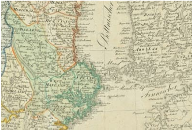
Kopparbergin läänin kuulunut Taalainmaa sijaitsee historiallisen Sveanmaan pohjoisosassa. Kuva on osa kartasta Charte von Schweden und Norwegen: nach den besten astronomischen Ortsbestimmungen entworfen von I.C.M. Reinecke; [...] (1809) .

Suomalainen tutkimus, jossa maatilojen sukupolvenvaihdokset on nähty lähtökohtaisesti joko sosiaalisesti eriarvoistavina ("läntinen malli") tai tasapäistävänä ("itäinen malli"), on perustunut makrotason tarkasteluille. Laajoissa yleistyksissä piiloon jäävien paikallisten variaatioiden ohessa tutkimuksessa vaatii lisää huomiota esimerkiksi se, että itäsuomalainen yhteiskunta oli ylipäätään hyvin "tasapäinen" viimeistään 1700-luvun taitteesta eteenpäin. Vähäininkin säätyläistö oli kuihtunut kriisivuosien seurauksena minimiin. Lisäksi maatilat olivat muuttuneet liki läpeensä kruununmaaksi, jolloin talonpojalla oli vain käyttöoikeus kruunun omistamaan maahan. Normatiivisesti määriteltynä sukupolvenvaihdos piti hyväksyttää kruununtiloilla aina maaherralla, mutta käytännössä myös niillä muutos oli perheen sisäinen asia.