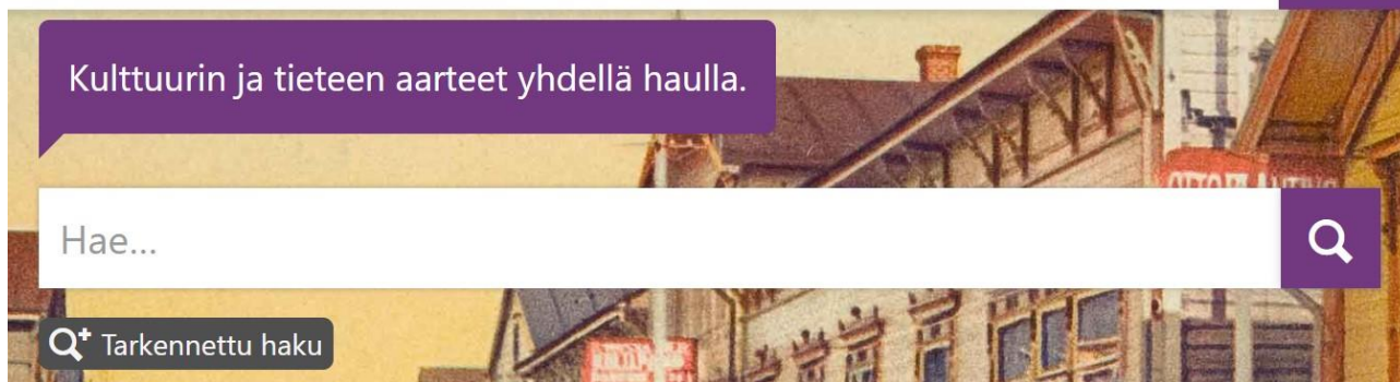
Kuva 1. Kuvakaappaus Finna.fi-hakuportaalin etusivulta.