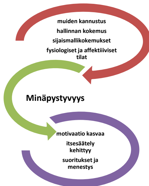
KUVIO 2. Minäpystyvyys. (mukaillen Bandura 2018.)

Banduran (1977; 1986; 2018) teoriassa keskeistä ovat myös minäpystyvyysuskomukset ja päämäärien asettaminen. Minäpystyvyys ei ole ihmisen persoonallisuuteen liittyvä ominaisuus, vaan se kuvastaa yksilön sisäisiä uskomuksia itsestään. Yksilö on siis samaan aikaan sekä toimintaympäristönsä tuotos, että myös tuottaja, kun hän valikoi, muuttaa ja luo erilaisia olosuhteita. Toiminnan arvioinnin lisäksi keskeistä ovat myös minäpystyvyysuskomukset ja päämäärien asettaminen. Nämä viittaavat yksilön kognitiivisiin ja sisäisiin tekijöihin. Uskomukset ovat ihmisen käsityksiä omista kyvyistään, ja tehokkuudesta vaikuttaa omiin valintoihinsa sekä niiden seurauksiin. Tämä tarkoittaa yksilön toiminnan itsearviointia. Positiivinen usko auttaa yksilöä ponnistelemaan tavoitteensa eteen, kun taas yksilön heikon pystyvyysuskon tilanteessa yksilö ei välttämättä edes yritä tavoitella päämääräänsä (Partanen 2011, 21–23.) Kuviossa 2 kuvaan minäpystyvyyttä.