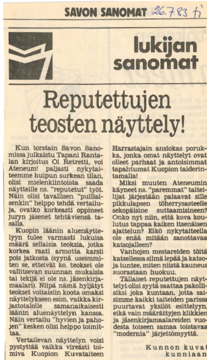
Kuva 2. Yleisönsastokirjoitus Savon Sanomissa 26.7.1983. Kuopion taidemuseon lehtileikearkisto.