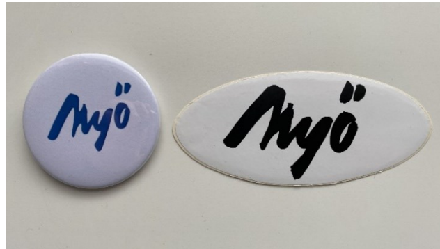
Myö-liikkeen logolla varustettu pinssi ja tarra – MYÖ: M.

Yhdistykseen jäsenmäärä pysyi koko toimintansa aikana alle sadan, ja muutokset voidaan yhdistää Myö-liikkeen kannatukseen kunnallispolitiikassa. Toinen huomattava tekijä jäsenmäärän kasvattamiselle olivat vaalivuodet, joiden aikana liike mainosti toimintaansa tavallista ahkerammin. Liikkeen alussa liike onnistui kokoamaan Lappeenrannan pienpuolueiden ja puoluekriittisten voimat, esimerkiksi jo olemassa olevista sitoutumattomista ja entisistä liberaaleista. Odotuksia heikomman vaalituloksen jälkeen jäsenmäärä lähti laskuun, mutta Myön noustessa kaupunginvaltuuston puheenjohtajaksi liikkeen jäsenmäärä kasvoi koko valtuustokauden ajan. Vuoden 2004 jälkeen jäsenmäärä kääntyi laskuun, ja kun liikkeen kannatus lähti laskuun vuoden 2012 vaalien jäsenmäärä tippui alle 50 henkilöön. 151 Tulee kuitenkin muistaa, että jäsenmäärät todellisuudessa olivat aina hieman suurempia, sillä osa ei maksanut jäsenmaksua. Maksun väliin jättäneitä poistettiin yhdistyksestä vuosittain.