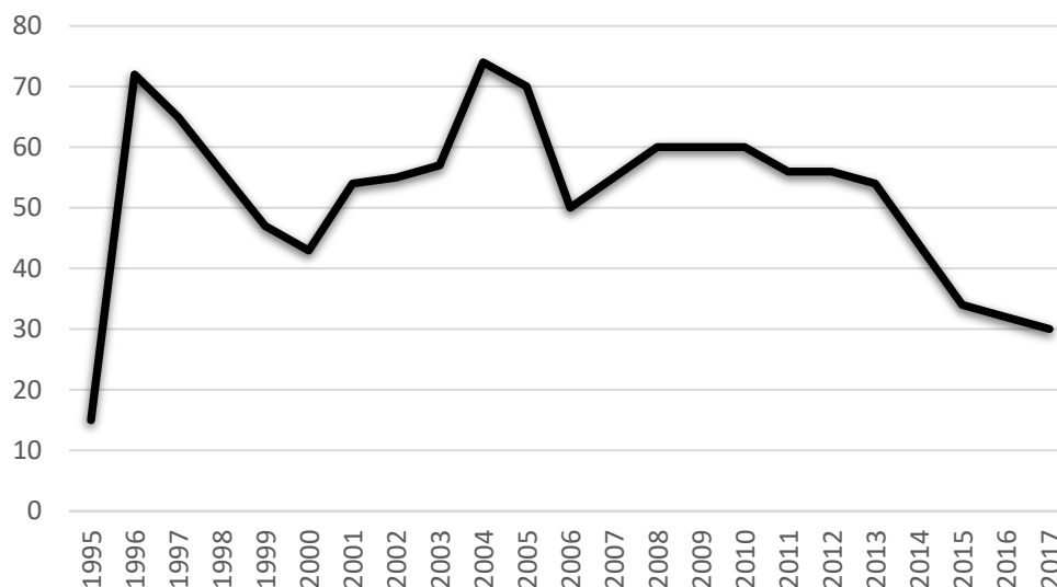
Kuvio 3. Jäsenmaksunsa maksaneiden jäsenten määrä vuosina 1996–2017. Lähde: Myö: pöytäkirjat.

Tammikuussa 1996 liikkeen perustamisen jälkeen liikkeen valtuutetut julistivat valtuustolle perustavansa ”Myö-kansalaisliikkeen” valtuustoryhmän, samalla eroten aikaisemmista valtuustoryhmistä. Valtuustoryhmän kerrottiin noudattavan liikkeen perustamisjulistuksen periaatteita ja pyrkivänsä tuomaan niitä kaupunginpolitiikkaan. 152 Valtuustoryhmä muodosti yhdistyksen lisäksi tärkeimmän Myön toimielimen, jonka vastuulla oli kaupunginvaltuutettujen toiminnan ylläpito ja järjestely. Valtuustoryhmien muodostaminen oli jo pitkään ollut olennainen osa kunnallispolitiikkaa, jossa valtuutetut, yleisesti yhden puolueen jäsenet, muodostivat ryhmittymän, joka käytti äänivaltaansa yhtenäisesti. Valtuustoryhmillä oli myös tapana koontua ennen valtuustokokouksia keskustelemaan käsiteltävistä asioista ja mahdollisesti päättää, mitä ryhmä yhtenäisesti äänestää. 153 Erot valtuustoryhmien sisäisestä kurista vaihtelivat ajallisesti ja paikallisesti, mutta Myön toiminnan aikana oli hyvin yleistä, että puolueiden valtuustoryhmät äänestivät yhtenä rintamana.