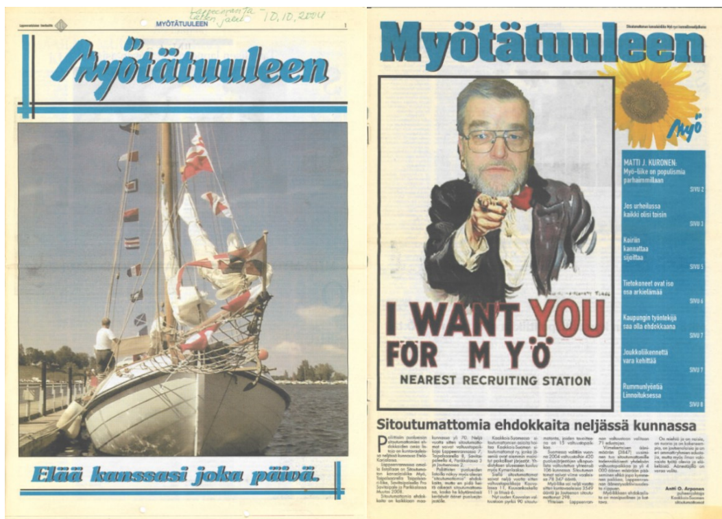
Kuva 3. Myötätuuleen -kunnallisvaalilehdet vuosilta 2004 ja 2008 olivat liikkeen laajimpia julkaisuja.

Tulosten seurauksena Myö menetti va’an kieliasemansa ja odotti kutsua mahdollisiin yhteistyöneuvotteluihin. Mahdollisuudet yhteistyöhön suurten puolueitten kanssa olivat kuitenkin kehnot. Jo ennen vuoden 2004 vaaleja liikkeen poliittinen asema oli heikentynyt liikkeen ja oikeistoryhmän välirikon seurauksena. Yhteistyö sitoutumattomien kanssa oli ollut ennen muuta kokoomuksen mielestä hankalaa, koska Myön jäsenet saattoivat olla asioista täysin eri