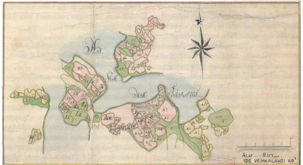
Osa Onkamaan kylän verollepanokartasta vuosilta 1774–1775. Talot on merkitty karttaan maakirjatiloin, vaikka todellisuudessa useampi kylän tila oli jo jakautunut osiin. KA Viipurin läänin verollepanokartat. 125 Vehkalahti 49:1.

ta yhtenevä Voionmaan 1600- ja 1800-luvun aineistoihin pohjautuvan näkemyksen kanssa. Yhtiöinä toimineiden kotitalouksien minimityövoimana on pidetty kolmesta neljään aikuista työmiestä. Voionmaan mukaan yhtiömiehiä oli ennen kaikkea ”pienissä vähäväkisissä” alle kymmenen hengen taloissa. 39