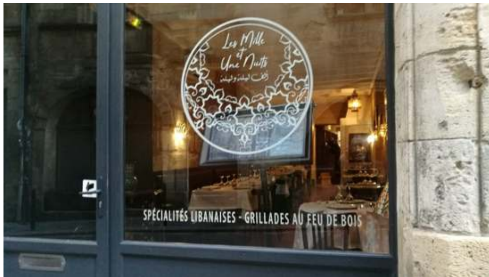
Figure 2. Restaurant « Les Mille et Une Nuits. Spécialités Libanaises – Grillades au feu de bois » (rue des Bahutiers).