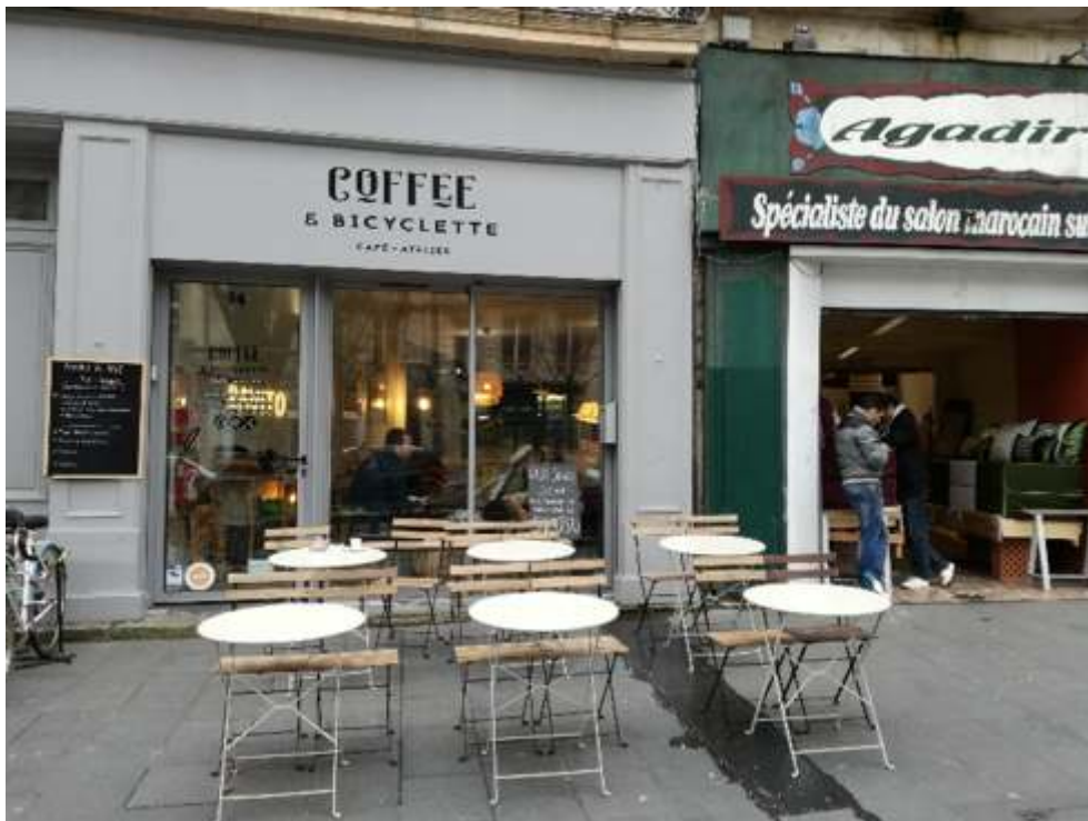
Figure 8. Nouvelle et ancienne boutique proche du quartier Saint-Michel (cours Victor-Hugo)