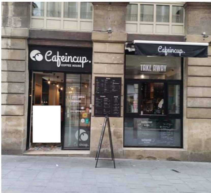
Figure 7. Devanture du café « Cafeincup » (rue Louis Combes)