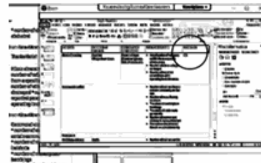
Kuva 2. Timin kursori on pysähtynyt.

1 Oili alright, just to ease Tim's writing can you:: say that okei, helpottaaksemme Timin kirjoittamista voitko sanoa saman 2 again Stacy cooperation with? uudestaan Stacy yhteistyö kenen kanssa? 3 Stacy sure. umh (0.2) yea- cooperation, (.) with:, (.) toki. öhm joo- yhteistyö yhdessä 4 l:ocal *ngo:s (.) and, io:s (hitaampi puhe) paikallisten ngo:n ja io:n kanssa tim *laittaa muten pois 5 Tim yea- [you can joo- [voit 6 Stacy [I- [minä- 7 Tim drop it in the uh uh chat ~[box pudottaa sen chat [laatikkoon 8 Stacy [okay. yeah. [okei. joo. oili ~kirjoittaa chatiin 'local ngos and ios' 9 Tim I can copy it then there °yeah.° voin kopioida sen sitten sieltä joo 10 Stacy great. eh hienoa. öh 11 Tim it- [it's se- [se on 12 Oili [there's the first part- (.) [siinä on ensimmäinen osa- 13 [first part Stacy-] [ensimmäinen osa jonka Stacy- 14 Tim [IT'S A MO:re ] quickly than I, .hh [se on paljon nopeampaa kuin minä