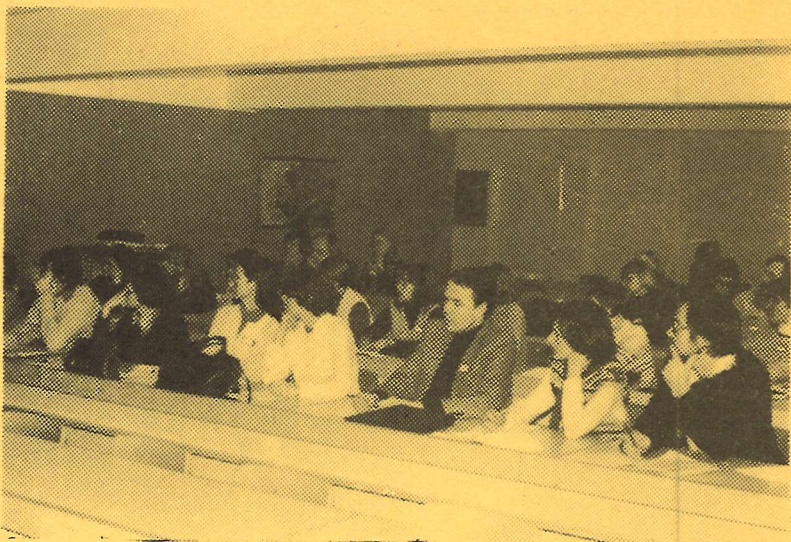
Language centre teachers attending the Lammi conference on the teaching of oral skills.

Vastaava toimittaja / Managing Editor: Liisa Korpimies Toimituskunta / Editorial Staff: Eva May Eila Pakkanen Liisa Ruuska Timo Sikanen Helena Valtanen