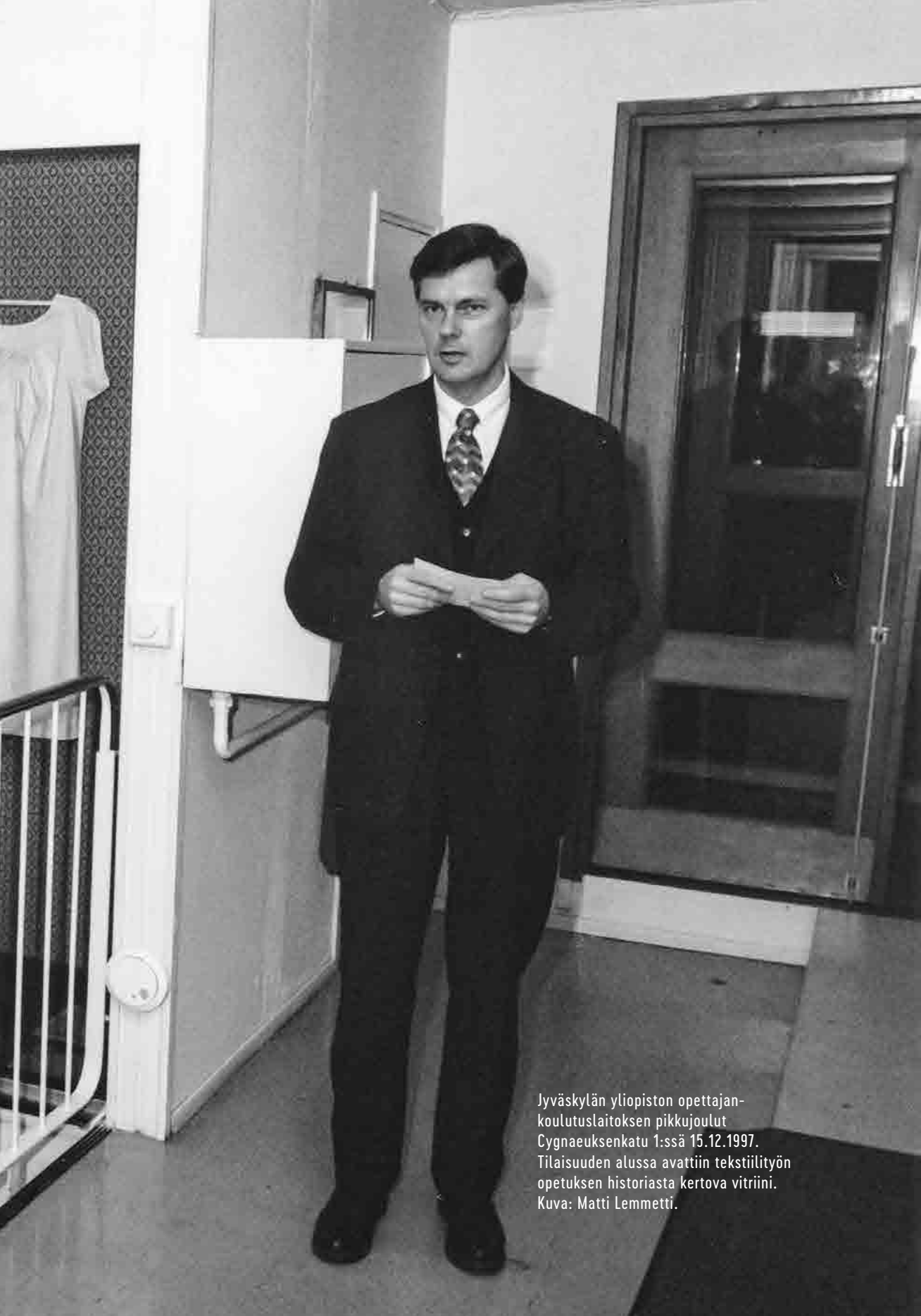
Jyväskylän yliopiston opettajan- koulutuslaitoksen pikkujoulut Cygnaeuksenkatu 1:ssä 15.12.1997. Tilaisuuden alussa avattiin tekstiilityön opetuksen historiasta kertova vitriini.