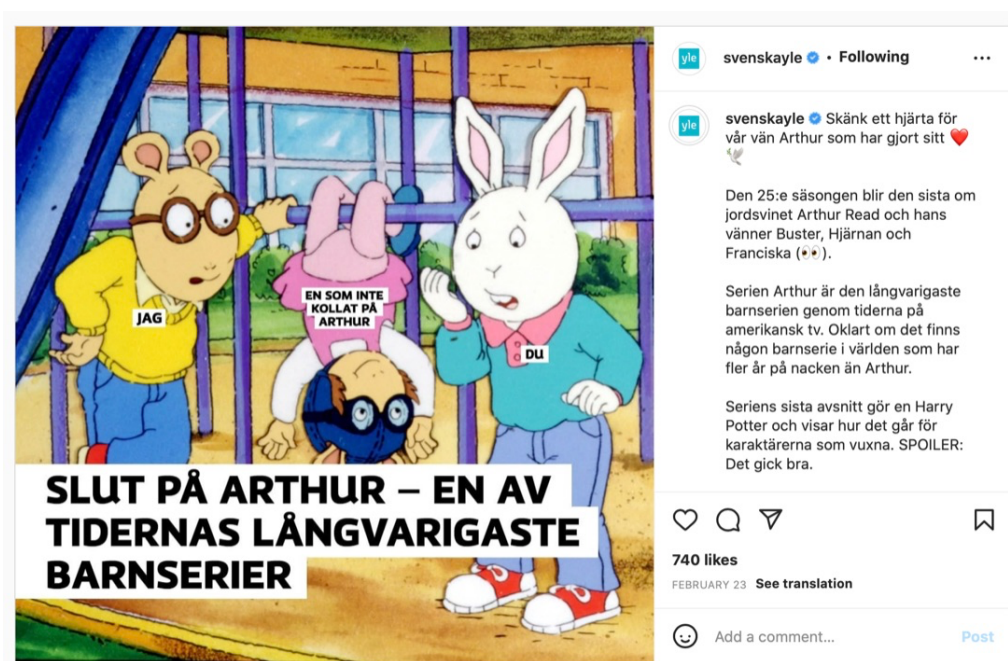
Bild 1. En skärmbild på nyheten Slut på Arthur – En av tidernas långvarigaste barnserier på Svenska Yles Instagram-konto

I detta kapitel kommer jag att analysera närmare strukturen och stilen i nyheten Slut på Arthur – En av tidernas långvarigaste barnserier (@svenskayle, 2022). Fulltextversionen av nyheten finns i slutet av denna avhandling som bilaga 2.