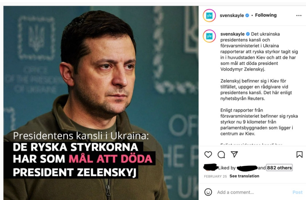
Bild 2. En skärmbild på nyheten Presidentens kansli i Ukraina: De ryska styrkorna har som mål att döda president Zelenskyj på Svenska Yles Instagram-konto

I detta kapitel kommer jag att analysera närmare strukturen och stilen i nyheten Presidentens kansli i Ukraina: De ryska styrkorna har som mål att döda president Zelenskyj (@svenskayle, 2022). Fulltextversionen av nyheten finns i slutet av denna avhandling som bilaga 3.