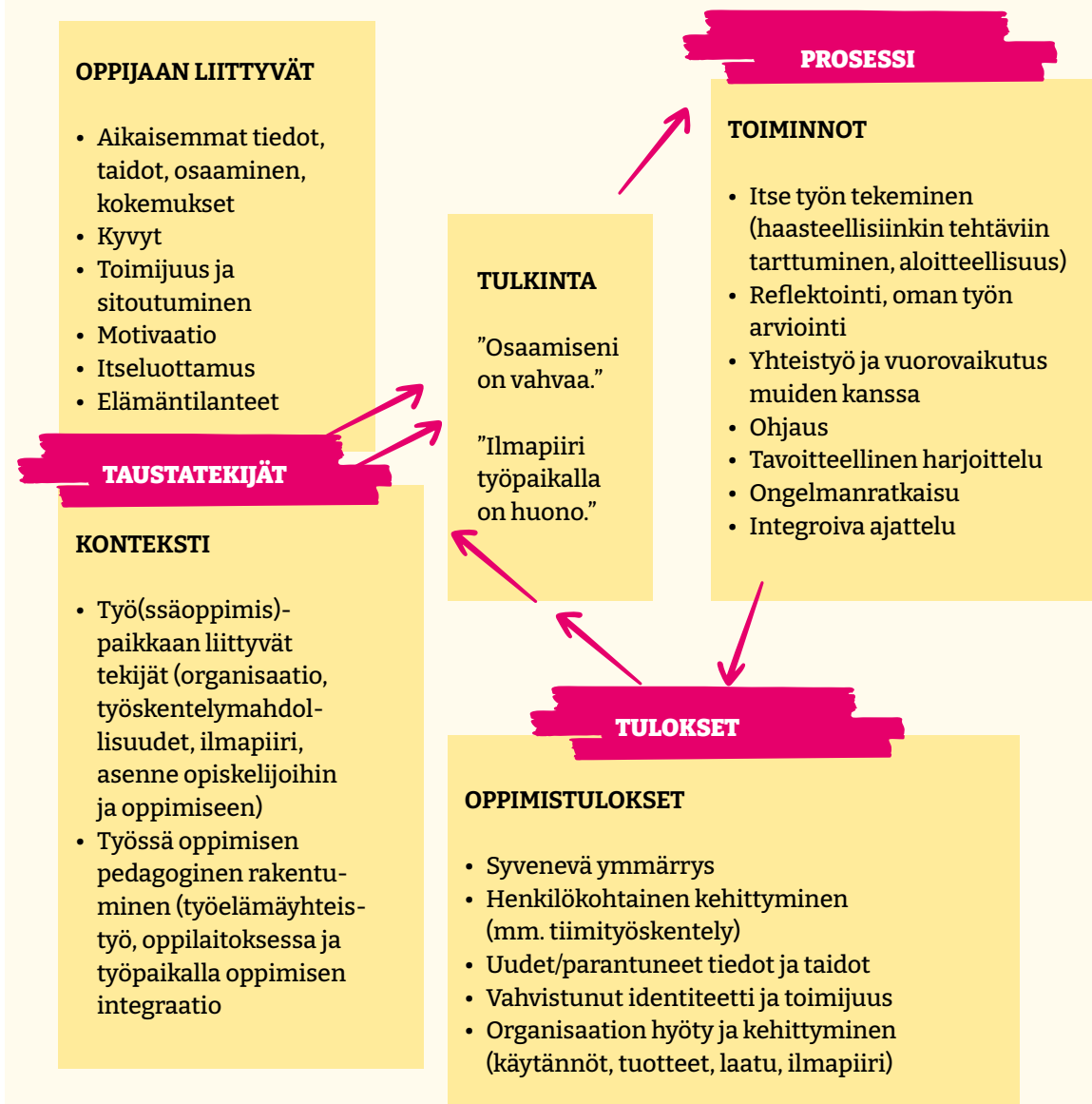
Kuvio 1. Opiskelijoiden työssä oppimisen kokonaismalli (Tynjälä ym., 2022, 80; muokattu Tynjälä, 2013 pohjalta).

Koulutuksen ja työelämän suhteet, työelämäyhteistyön käytänteet, käytännön yhteisöt, organisaatiokulttuuri