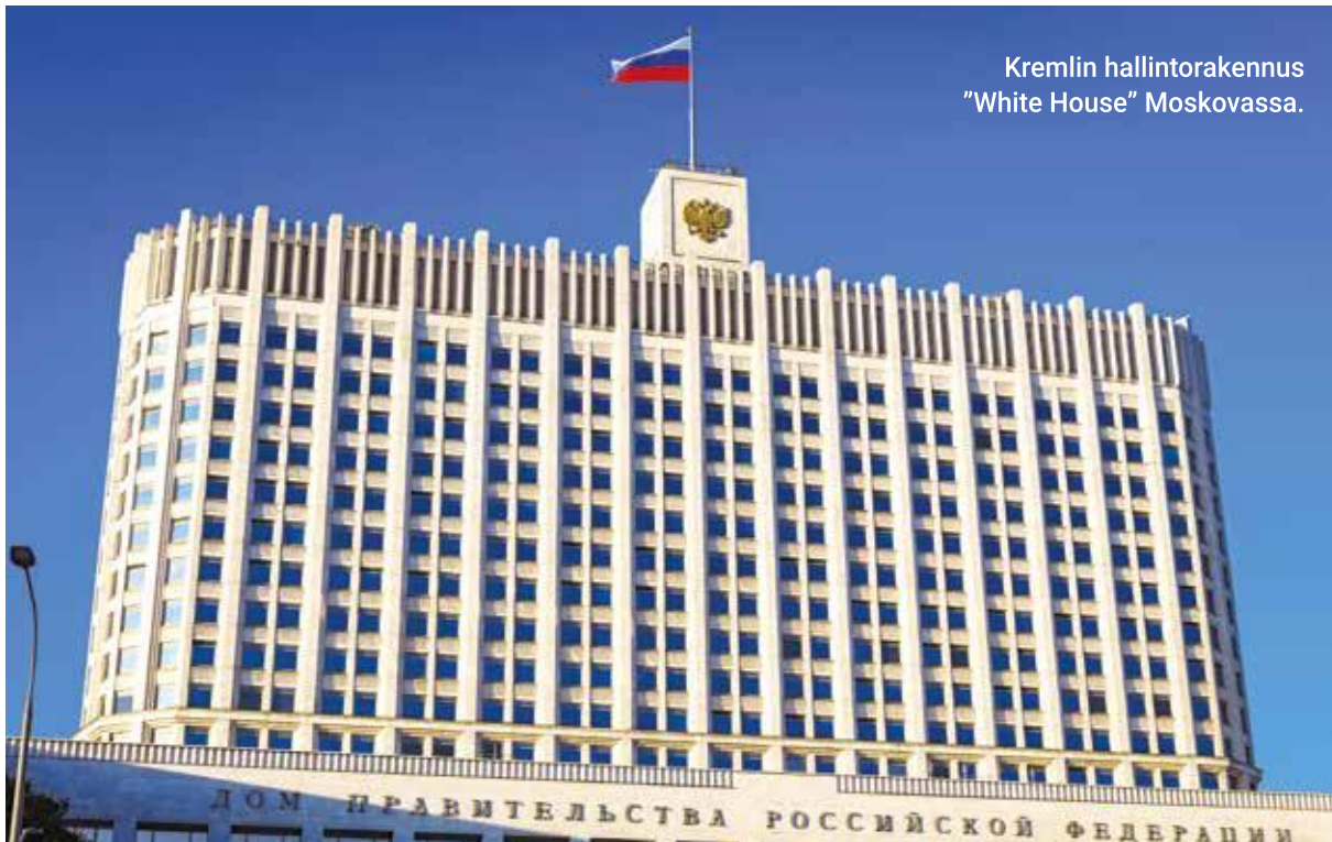
Kremlin hallintorakennus "White House" Moskovassa.

lasoperaatioita. Jatkuvan sodan narratiivista on tullut Vladimir Putinin hallinnolle tärkeä keino pysyä vallassa. Jatkuva puolustussotaa ei käydä vain Syyriassa ja Ukrainassa, vaan myös informaatiotilassa ja Venäjän sisällä. Sodasta on tullut Venäjällä arkipäivää. Presidentin tiedottaja Vladislav Surkov totesi jo vuonna 2004, että vihollinen on porteilla, eikä vain porteilla, koska piiritystyössä kaupungissa sisällä on ulkovaltojen tukema viides kolonna.