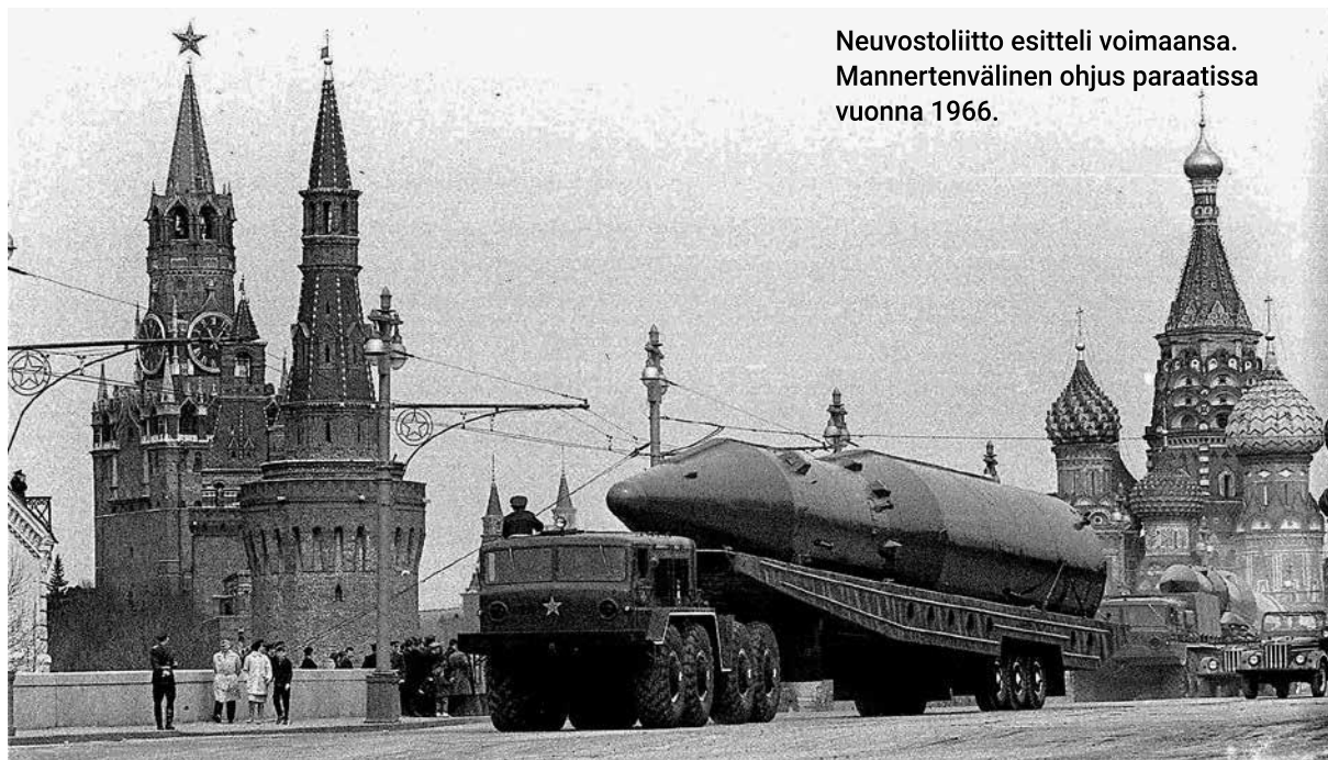
Neuvostoliitto esitteli voimaansa. Mannertenvälinen ohjus paraatissa vuonna 1966.

Niille, jotka ovat ihmetelleen esimerkiksi ulkoministeri Sergei Lavrovin kertomuksia etnisesti kohdistuvasta biologisesta aseesta Kennan toteaa, että Kremlillä on vapaus esittää mitä tahansa väitteitä, joita se pitää asiansa kannalta hyödyllisenä ja vaatia niiden ehdotonta hyväksymistä. Totuus Venäjällä ei ole vakaa vaan Kremlin itsensä luomaa. Kennanin mukaan totuus voi Venäjällä vaihdella viikoittain. ■