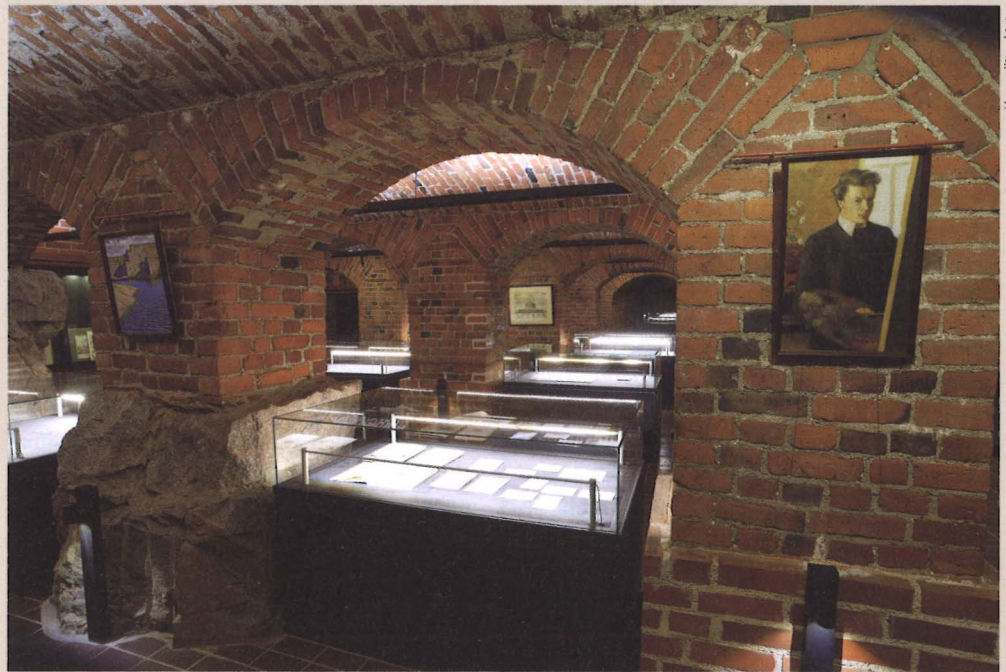
Viapori-Suomenlinna - Kolmen valtakunnan linnoitus 1748-2021 on avoinna 30.9.2022 saakka.

Näyttelykokonaisuus sijaitsee Kansallisarkistossa ja Suomenlinnakeskuksessa, ja siinä