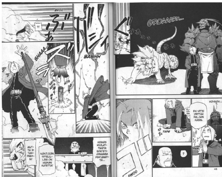
Kuva 4. Fullmetal Alchemistin Edward Elric syntetisoi lattiasta keihään alkemian avulla.

rinteessä, sillä on useita yhtymäkohtia satuihin ja usein sen rinnalla kulkee myös tieteellisestä maailmankuvasta ammentava tieteisfiktio. Itse puhuisinkin mieluummin laajasti spekulatiivisesta fiktios- ta, joka kattaa kaikki yliluonnollisia elementtejä sisältävät alagen- ret, kuten esimerkiksi fantasian, tieteisfiktion, ja kauhun. (Konttu- ri 2014, 39–40.) Seuraavaksi esittelen muutaman sarjakuvan klas- sikon, jotka sopivat laajemman määritelmän mukaan spekulatiivi- sen fiktion piiriin, mutta joiden voidaan myös katsoa olevan fan- tasia-sarjakuvia.