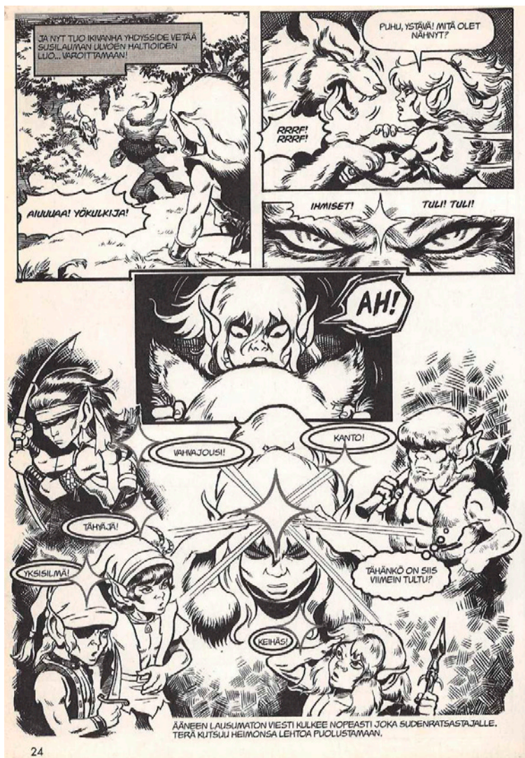
Kuva 1. Terä viestii heimonsa ja susien kanssa telepaattisesti.