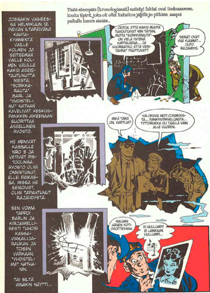
Kuva 5. Eisnerin poikkeuksellista ruutusommittelua.

Will Eisnerin Spirit puolestaan on film noir -henkistä rikosfiktiota, joka koostuu useista lyhyistä tarinoista. Päähenkilö on kuoleista herännyt naamiosankari Spirit, joka ratkaisee rikoksia poliisi-