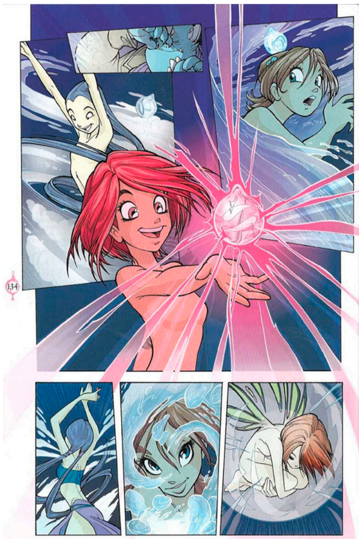
Kuva 3. W.I.T.C.H. -sarjakuvan muodonmuutokset kuvataan usein erilaisin ruutusommitelmin.