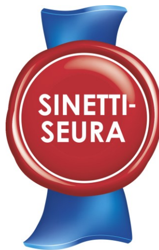
KUVA 1. Sinettiseura-toiminnan laatumerkki.

Sinettiseura-toiminnassa lajiliittojen rooli oli varsin merkittävä, sillä lajiliitot vastasivat kokonaisuudessaan Sinettiseura-toiminnan läpiviemisestä seuratasolla. Lajiliittojen nuorisovastavat valitsivat jäsenseuroistaan ne seurat, jotka pääsivät mukaan kyseiseen toimintaan. (Lehtonen 2005, 6) Keskeisin tarkoitus oli parantaa lasten ja nuorten urheiluseuratoiminnassa huomattuja epäkohtia, joista huomio kiinnittyi etenkin lasten ja nuorten epätasa-arvoiseen kohteluun ja kilpailamisen liialliseen korostamiseen. Sinettiseura-toimintaan valittujen seurojen avulla pyrittiin luomaan esimerkkejä uudenlaisesta urheiluseurakulttuurissa, joka huomioisi lapset ja nuoret tasa-arvoisesti ja edistäisi valmentajien kehittymistä. Toiminnan kautta luotiin Sinetti (kuva 1), joka edusti arvostettua ja laadukasta seuratoimintaa. (Lehtonen 2005, 8)