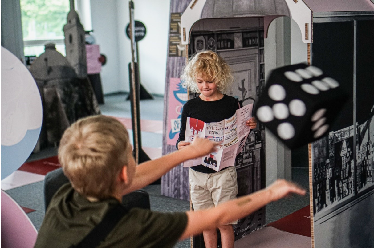
Kuva 6 Skidipeli Hämeenlinna markkinointikuva lapsi heittää noppaa