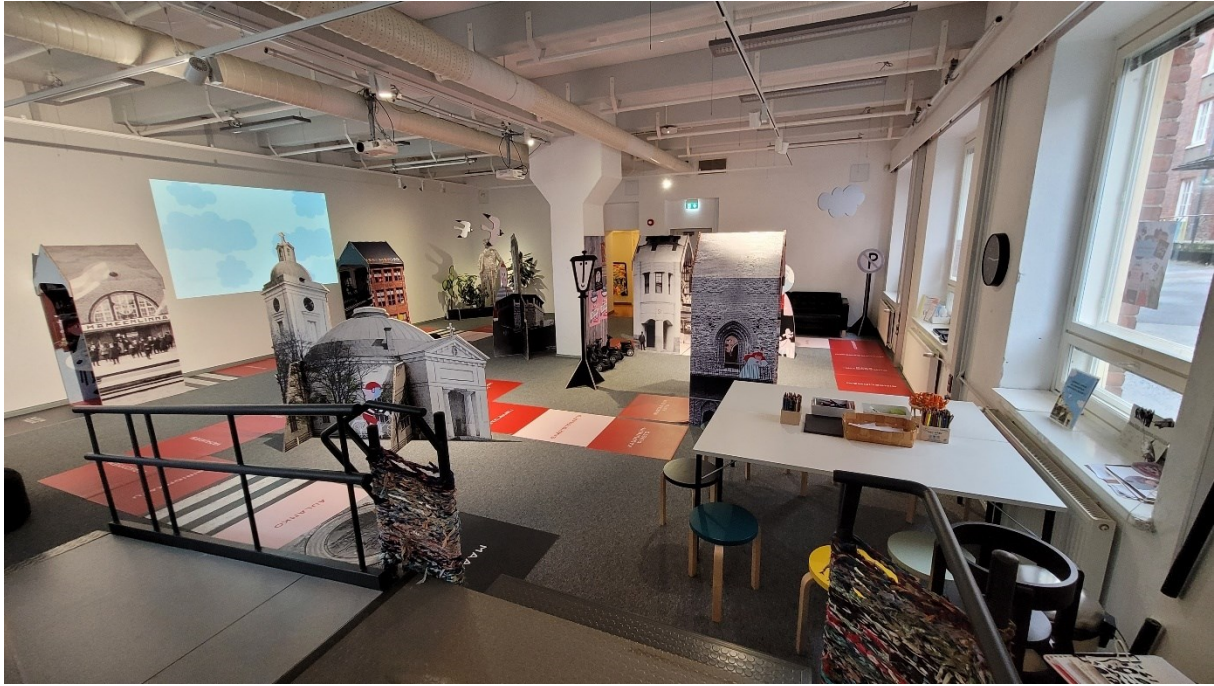
Kuva 1 ARXin näyttelytila ovelta kuvattuna

Tilaan tulevat lapset aikuisineen odottavat sisälle pääsyä ulkona, kunnes opas avaa ryhmälle ulko-oven. Eteiseen nousee metallisia ulkorappusia pitkin, askelmia on kaksi. Ovi aukeaa tuulikaappiin, johon jätetään kengät sekä ulkovaatteet. Tässä eteisessä lapset viettävät ulkovaatteiden riisumiseen kuluvan ajan sekä odottavat kunnes koko ryhmä on valmiina, tutkien samalla katseellaan eteistilaa. Lasten vaatteet naulakossa sekä ulkona olevat värikkäät lasten maalaamat kukkaruukut antavat merkkejä siitä, että kyseessä on lasten tila.