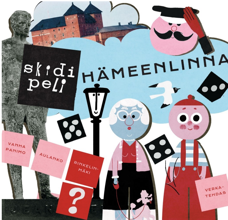
Kuva 4 Skidipeli Hämeenlinna markkinointikuva / Kuvitus: Sanna Mander

vaikutuksen toimijuuteen ja sen havainnointi vaatii jo lasten hyvää tuntemista ja tähän voi saada apua ryhmän kanssa työskenteleviltä aikuisilta. Aikuislähtöistä ohjausta vältetään ja lasten toimijuus pyritään saamaan esiin antamalla tilaa lapsille toimia vapaasti. Lasten mahdollisuudet valita, vaikuttaa ja toimia valinnan mukaan on toimijuutta ja huomionarvoisia ovat pienimmätkin valinnat, vaikutukset ja toiminta.