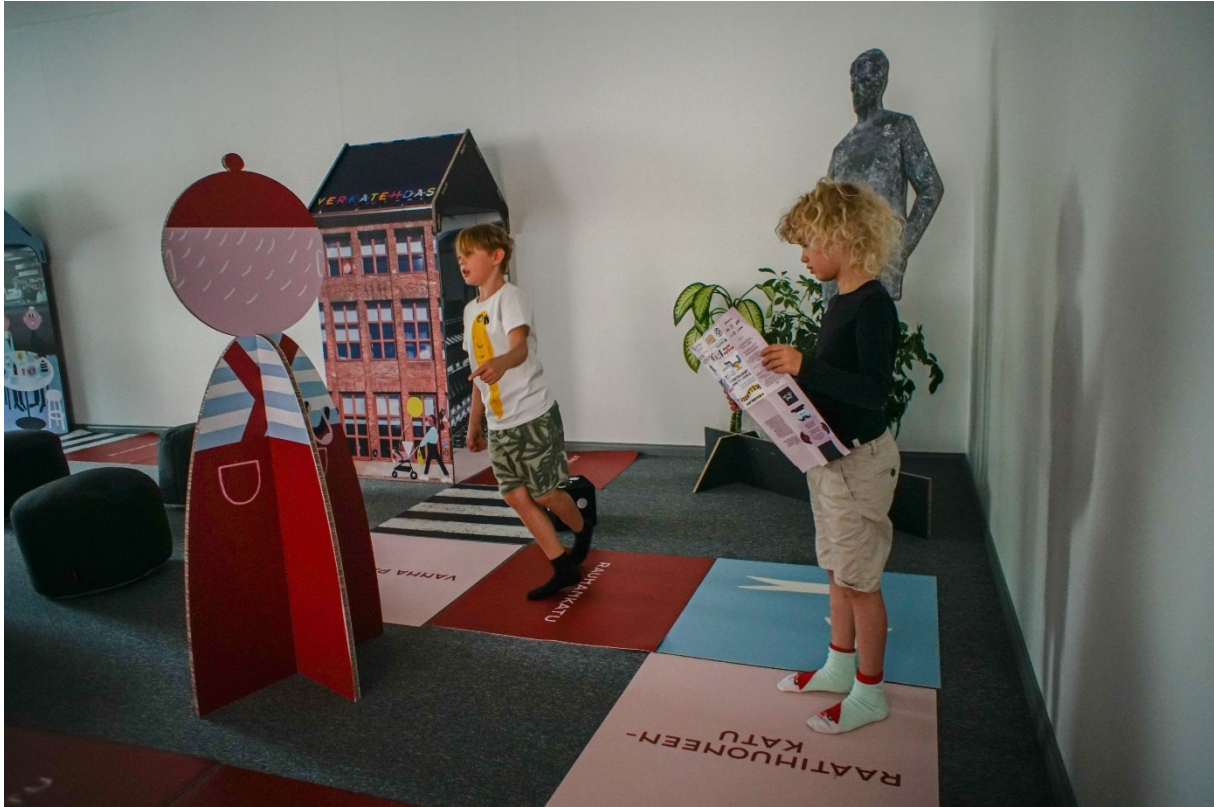
Kuva 10 Skidipeli Hämeenlinna markkinointikuva lapsi lukee ohjetta