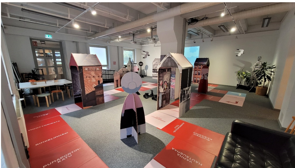
Kuva 3 Skidipeli Hämeenlinna ikkunaseinältä kuvattuna / Kuva: Sarina Pulkka

Lapsi ja aikuinen ovat näyttelytilassa yhdessä ja yhtä aikaa. Tilassa ovat aikuiset, jotka tuovat lapsen tai lapset tilaan sekä aikuinen, joka on töissä tilassa. Aikuiset järjestävät lasten puolesta vierailun ja tuovat lapset paikalle ja näin mahdollistavat lapselle kulttuurikokemuksen. Aikuiset toimivat lapsen toimijuuden mahdollistajina. Koska näyttelyvierailu on päiväkodeille ja kouluille vapaaehtoista, jää ryhmän aikuisten päätettäväksi osallistuvatko he vai eivät.