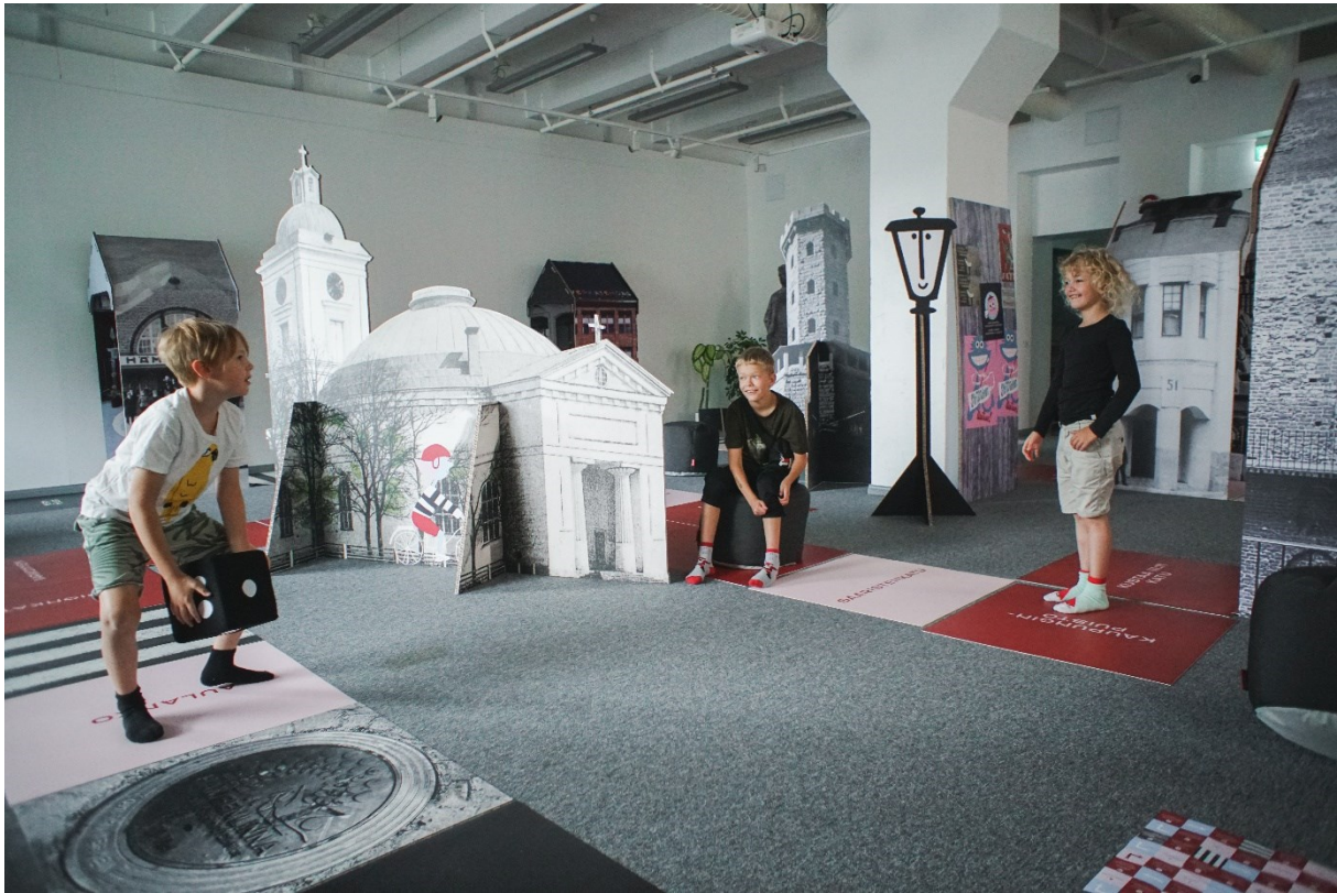
Kuva 9 Skidipeli Hämeenlinna markkinointikuva lapset pelaavat / Kuva: Liina Harhala ARX

mielestäni siitä, että lapset tunsivat olonsa hyväksytyiksi ja tasa-arvoisiksi. Jos he olisivat pelänneet mitä tilassa saa tehdä, he eivät olisi uskaltaneet korjata sanojani.