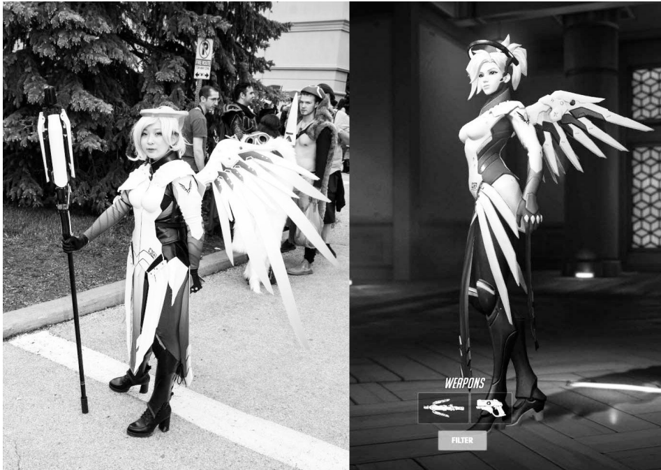
Kuva 3. Overwatch -pelin hahmo Mercy (oik.) ja häneen perustuva asu (vas.) ovat hyviä esimerkkejä pelaajien moninaisista pelaamiseen liittyvistä käytänteistä. Oikea kuva: Kuvakaappaus pelistä. Vasen kuva: Xander Ashburn. https://flic.kr/p/UcSvGM . Käytetty lisenssillä CC BY 2.0 https://creativecommons.org/licenses/by/2.0/deed.fi .

vässä määrin mediaurheilua, 86 on kilpapelaminen luonteeltaan transmediaurheilua.