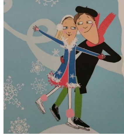
Kuva 6 (Bondestam 2008)

Kaikesta vakavuudesta, rauhallisuudesta ja huolellisuudesta huolimatta neiti Talvi ei ole persoonallisuudeltaan täysin passiivinen, eikä talven representaatio jumitu pelkkään hiljaiseloon ja horrokseen. Hän on toisaalta myös hiukan neiti Syksyä energisempi henkilöahmo, mikä näkyy selvästi kuvassa 6, jossa hän on tyytyväisenä luistelemassa Tenho Tuulen kanssa. Tämä rakentaa ainakin sellaista vuodenaikarepresentaatiota, että syksyllä ihmiset pysyttelevät enemmän kotosalla, kun taas talvella mennään jo mieluummin ulos esimerkiksi talviurheilemaan.