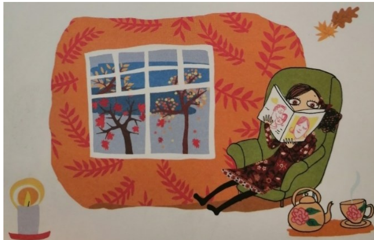
Kuva 3 (Bondestam 2008)

Lisäksi rouva Kevät toteaa, että neiti Syksy ”vain polttelee iltaisin kynttilöitä ja lukee vanhoja aikakauslehtiä” (Nopola 2008), mikä pehmentää hahmon persoonallisuudesta rakentunutta yleiskuvaa entisestään. Kuvassa 3 neiti Syksyn ympäristö näyttää hyvin kotoisalta ja olemus rentoutuneelta. Henkilöhahmo ei olekaan läpikotaisin kylmäluontoinen ja alakuloinen, vaan toisaalta erittäin samastuttava ja mukavuudenhaluinen introvertti. Tämä Rouva Kevään alun perin nuhteeksi tarkoitettu toteamus tuokin esiin joitain syksyn mukavimpia puolia, joten syysvuodenajan representaatio ei jää teoksessa täysin synkeäksi.