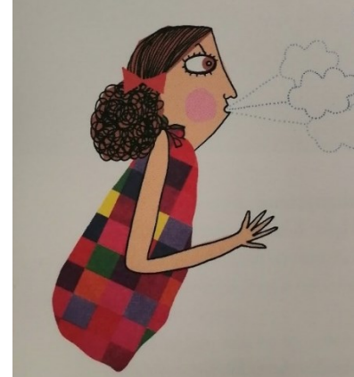
Kuva 2 (Bondestam 2008)

Hortensia Syksy on persoonaltaan myös melko temperamenttinen. Herra Kesä oli kerran hurmannut hänet ja lukinnut sitten uimarannan pukukoppiin saadakseen pysyä kaupungissa ihmisten ihailtavana pidempään. Tällöin neiti Syksy oli kertomansa mukaan alkanut puhaltaa pohjoistuulta rannalle ja ajanut ihmiset sekä Kimmo Kesän heidän mukanaan pois paikalta. ”Uimakopin lukko oli vanha ja hauras, joten annoin pohjoistuulen tuisuttaa ovea. Sitten työnsin sen auki ja astelin rannalle.” (Nopola 2008) Myös tätä kohtaa täydentävä kuva (kuva 2) antaa neiti Syksystä hyvin kipakan ja sisukkaan käsityksen. Hänen kulmansa ovat ärhäkästi kurtussa ja posket punoittavat voimakkaasta puhaltamisesta. Kaiken kaikkiaan Hortensia Syksyn temperamenttisuus viittaa siis ainakin tuulisiin ja toisinaan myrskyisiinkin syyssäihin.