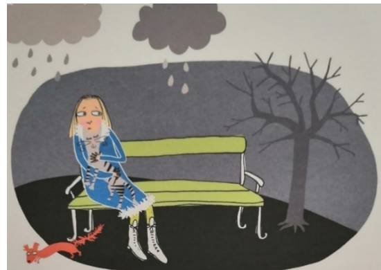
Kuva 5 (Bondestam 2008)

Neiti Talven persoonallisuuteen kuuluu siis tietty huolellisuus, joka kulkee käsi kädessä hänen vakavuutensa ja miellyttämisen halunsa kanssa. Henkilöhahmo ottaa yleensä työnsä vakavasti niin kuin syksyinen sisarpuolensakin. Hänelle on lisäksi todella tärkeää pitää tunnollisesti muille antamansa lupaukset, minkä vuoksi myös kodin löytäminen herra Kesän kesäkissalle aiheuttaa hänelle todellista päänvaivaa. Hänen huolensa ja surunsa näkyy selvästi kuvassa 5, jossa värimaailma on erittäin synkeä ja henkilöhahmon ilme kovin ahdistunut. Sateinen säätila korostaa surkeaa tunnelmaa entisestään, ja Anna Talvi pohtii: ”Haluaisin niin kovasti, että herra Kesä olisi onnellinen.” (Nopola 2008).