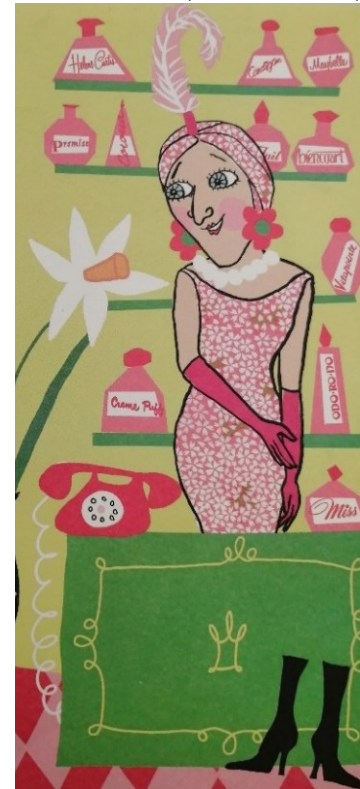
Kuva 7 (Bondestam 2008)

Mielenyhtymä näiden kahden sanan välillä vahvistuu Rouva Kevään persoonallisuutta tarkasteltaessa, sillä hän on luonteeltaan varsinainen primadonna. Hän näkee itsensä ylempiarvoisena kuin muut vuodenaikahahmot, mikä toisaalta liittyy myös hänen haluunsa edelleen holhota ja kasvattaa tyttäriään: esimerkiksi neiti Talvelle hän valittaa tämän työnteon myöhästymisestä sekä kuluneesta takista, jota tämä pitää yllään. Hortensia Syksyn hän puolestaan väittää olevan aina tylsistynyt ja yksinäinen. ”Kuinka minulla onkin noin kalvakkaita ja tylsät tyttäret? Ettekö te haluaisi joskus häikäistä loistollanne kaupungin väkeä?” Rouva Kevät kerran puuskahtaa. Kimmo Kesää hän taas pitää ”ailahtelevaisena keikailijana”.