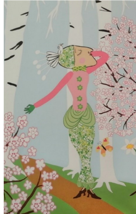
Kuva 17 (Bondestam 2008)

Nämä kaksi henkilöhahmoa ovat myös sosiaalisempia kuin kaamoshahmot: sosiaalisuudella viitataan tässä kontekstissa haluun viettää paljon aikaa seurassa sekä kykyyn olla vaivattomasti vuorovaikutuksessa muiden kanssa. Rouva Keväässä tämä ilmenee lähinnä haluna tulla nähdyksi ja siinä, miten hän on valinnut toimivansa sosiaalisessa asiakaspalveluammattissa (hajuvesipuodin pitäjänä). Hän ei ole myöskään ollenkaan vetäytyvä, vaan hyvin räiskyvä ja puhelias. Kimmo Kesäkin nauttii huomiosta, mikä näkyy muun muassa hänen useissa samanaikaisissa romansseissaan sekä hänen halussaan jäädä ihmisten ihailtavaksi mahdollisimman pitkäksi aikaa. Lisäksi hän on useimmissa teoksen kuvista julkisilla paikoilla, kuten uimarannoilla tai pirtelöbaarissa, muiden ihmisten ympäröimänä. Niin kuin totesin aiemmin luvussa 4.1, valon määrällä on tutkitusti vaikutusta myös sosiaalisuuden tasoon, sosiaaliseen toimintaan ja jopa vuorovaikutustaitoihin (Sun ym. 2021, 1265). Rouva Kevään ja Kimmo Kesän sosiaalinen aktiivisuus on mielenkiintoisesti rinnastettavissa tähän, sillä he representoivat juuri valoisampia vuodenaikoja. He ilmentävät sitä, miten monet ovat keväisin ja kesäisin aktiivisempia, liikkuvat enemmän pois kotoa ja tapaavat useammin muita ihmisiä.