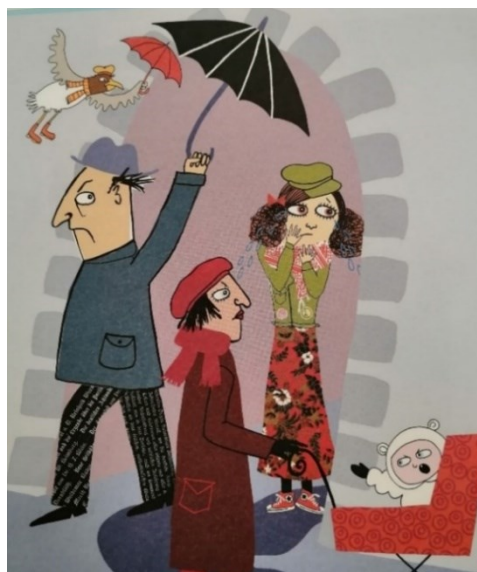
Kuva 1 (Bondestam 2008, ei sivunumeroita)

Tämä kohta tarinassa korostaa syyskuukausien ”huonoja puolia” kuten kylmää tuulta, sateisuutta ja märkää maata. Teksti antaa jo itsessään hyvän käsityksen siitä, millaista kuvaa tässä kohdassa vuodenajasta yritetään välittää, mutta aukeaman kuvitus vahvistaa sitä entisestään. Kuvassa 1 kaduilla kävelevät ihmiset näyttävät pahantuulisilta ja kyllästyneiltä: jopa vauva huutaa tyytymättömän näköisenä kärryissään. Kuvan hämärät ja harmahtavat sävyt voimistavat tätä tunnelmaa yhdessä elementtien asettelun kanssa: kauniisiin ruskan väreihin pukeutunut neiti Syksy seisoo syrjässä murheellisena, kun