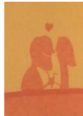
Kuva 10