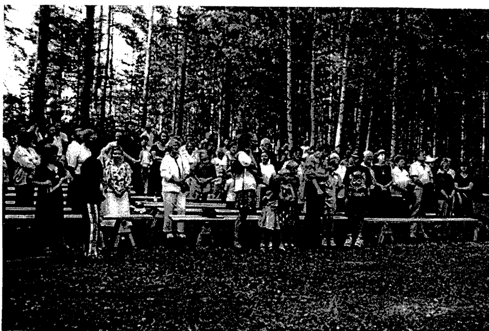
Karjalaisten laulu lauletaan 20.7. 1997 vietetyn kesäjuhlan päätteeksi