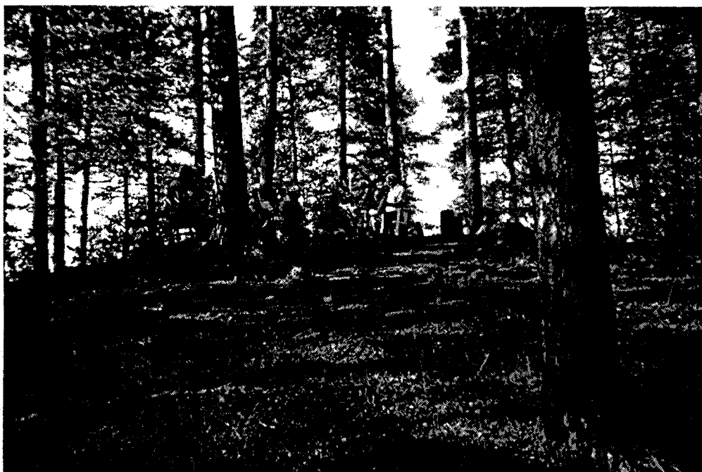
Torvisoittoa Pikku-Punkaharjun laella kesäjuhlassa 20.7. 1997