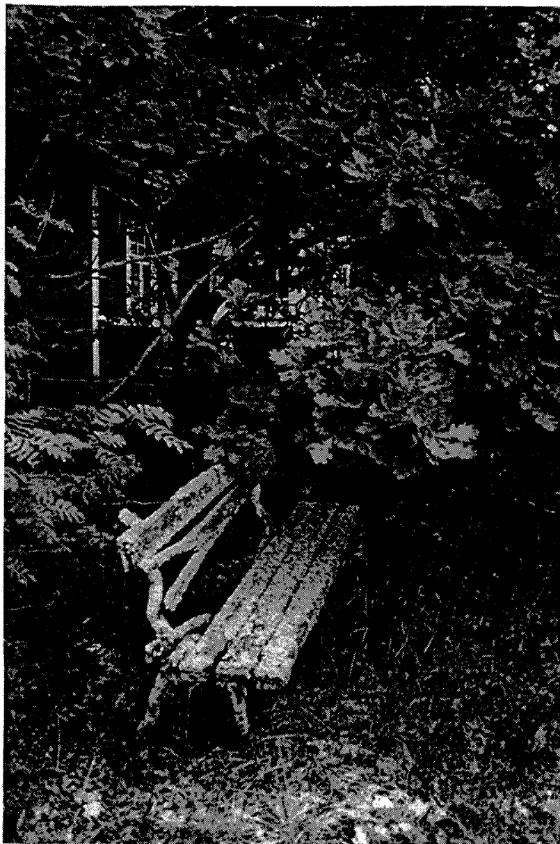
Menneisiin kesiin unohtunut penkki vanhan huvilan pihalla (kesällä 1997)