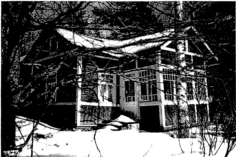
Opettaja Aallon kesähuvi. Rakennus muutettu huvilaksi 1900 -luvun alussa (kuv. Katri Pyysalo keväällä 1994)