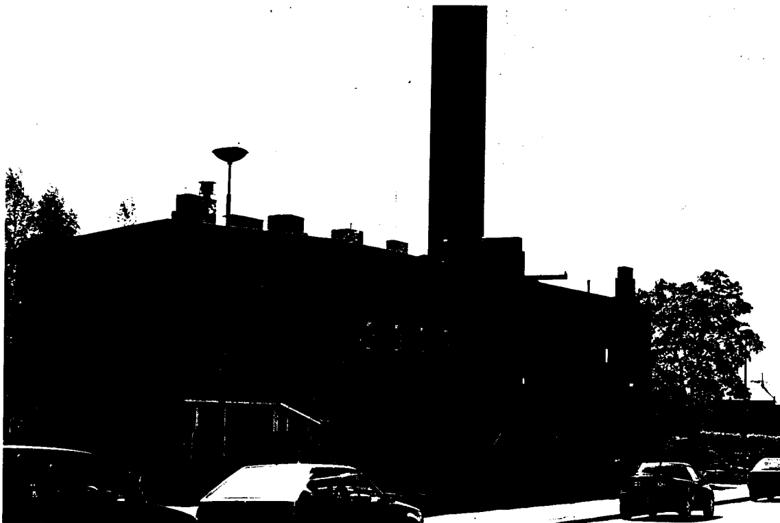
Rautpohjan saunarakennus kesällä 1999.

Saunat ja pyykkituvat arkirituaalien näyttämöinä