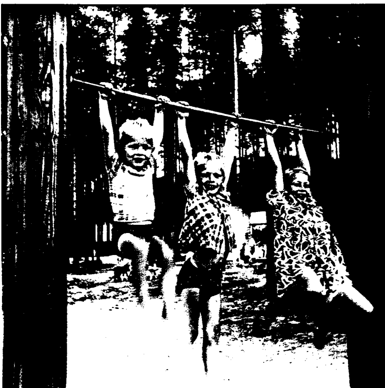
Lapsia Valimonmäessä 1950-luvulla.

“Meilläkin siellä Saunatiellä [Valimonmäessä], niin järjestettiin siihen metsän reunaan laitettiin puitten väliin naru ja siihen sitten tuota nää tämmöset joko vanhoja verhoja tai sitten jotain peittoja. Siellä esiinnyttiin aikuisille.” (N241.)