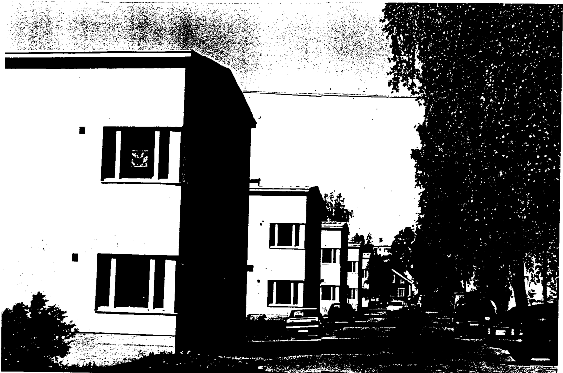
Rautpohjan asuinalueetta kesällä 1999.

luomaan ja pitämään yllä vuorovaikutussuhteita kauempana asuviin tuttaviiin ja ottamaan osaa uusiin harrastuksiin, jotka eivät olleet sidoksissa tehtaaseen tai omaan asuinalueeseen. Rautpohjalaisten ja valimonmäkeläisten elämänpiirin laajetessa asuinalueiden ulkopuolelle ja toisaalta sen kutistuessa oman perheen ympärille, lakkasivat monet aiemmin voimakkaina vaikuttaneet yhteisöllisen kulttuurin muodot. Esim. tehtaan teatteri, lasten harrastukset ja monet puulaakijoukkueet lopettivat toimintansa ja tilalle tulivat elokuvat, ravintolat ja kaupunkilaisten yhteiset harrastusmahdollisuudet sekä kasvava kulttuuritarjonta. Enää ei lähdetty tehtaan kopiautoilla yhteisille marjaretkille, koska ihmiset halusivat tehdä ne perheen kesken omilla autoillaan.