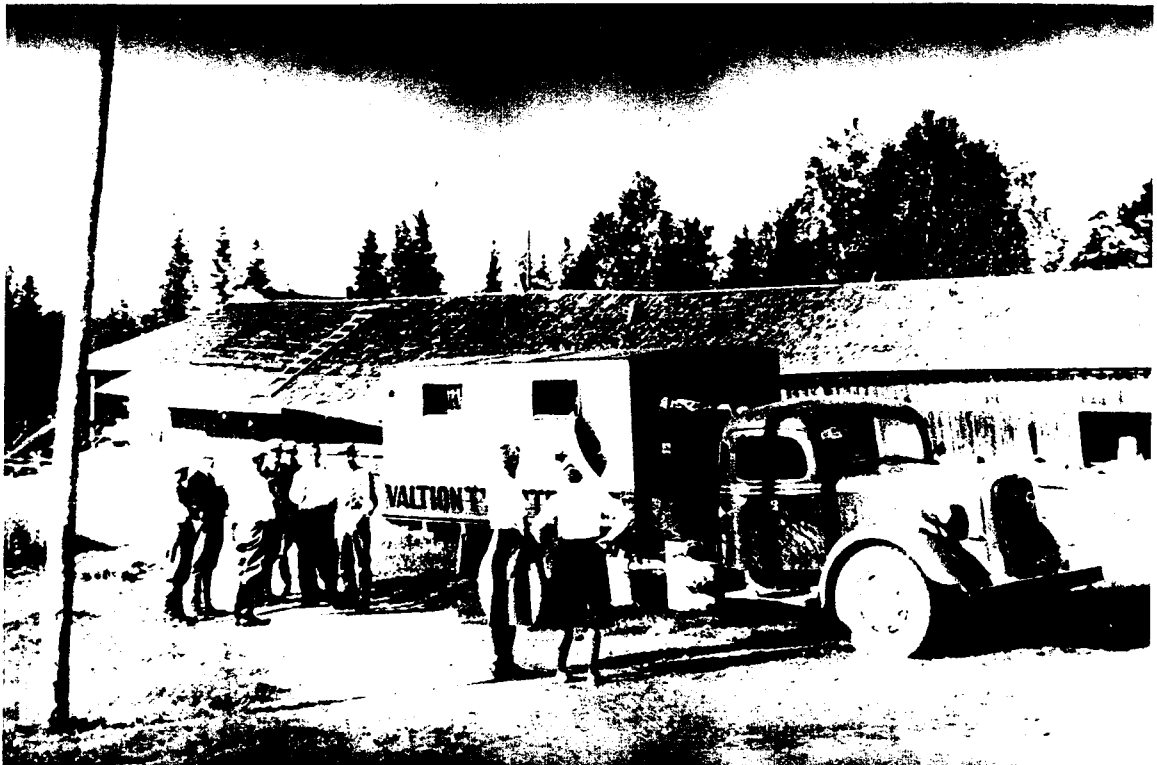
Esitysmatkat teatteri teki tehtaalta lainaamalla koppi-autolla, jota käytettiin muuhunkin henkilökunnan sosiaaliseen toimintaan (M130, M224, M836, Jokinen 1988b: 83).

Vaikka useimmissa näytelmistä ei ollutkaan mukana lapsia, olivat he silti oleellinen osa näytelmäkerhon elämää. Jos molemmat vanhemmista olivat aktiivisesti teatterissa, joutuivat he ottamaan lapset mukaansa harjoituksiin. Näin lapsille tuli tutuksi sekä teatterielämä että myös itse näytelmät: