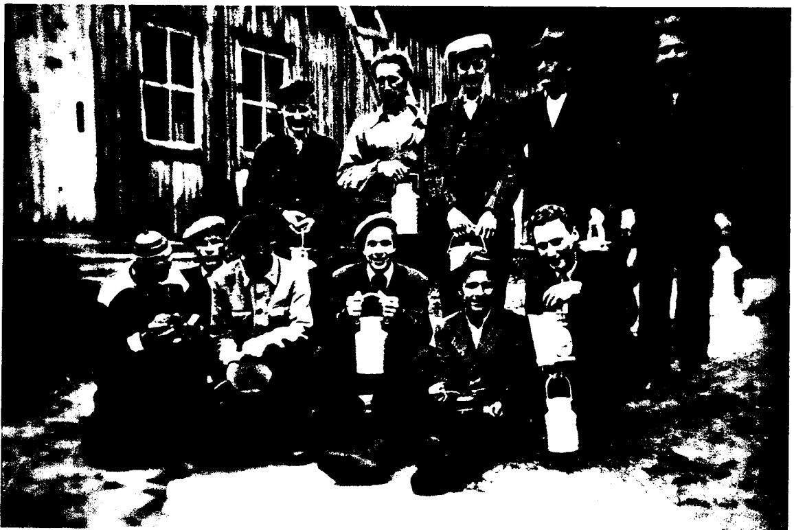
Tehtaalaisia Vasikkalammella Metalliliiton lakon aikana vuonna 1952 lähdössä lakkolaisille ja heidän perheilleen tarkoitettuun keittojakeluun Valorinteelle (M224).

“Isä oli kova politikoimaan. Se lähti äkkiä ruokatunnille ja takasin, että kerkee ruokatunnilla vielä puhua.” (M449.)