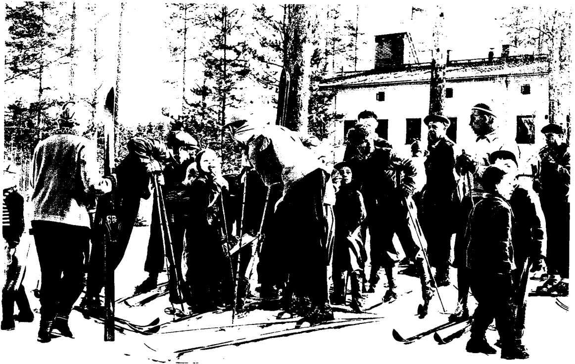
Massahiihdot Valimonmäessä 1950-luvulla.

Tykkitehtaan ja myöhemmin Rautpohjan tehtaan henkilökunta harrasti aktiivisesti amatöörimaista puulaakiturheilua johtajista ja konttorihenkilökunnasta työläisiin saakka. Eri osastot, kuten esim. Kokoonpano-, Raskaskoneistus- ja Jyrminosasto, muodostivat omia jalkapallo-, pesäpallo-, lentopallo- ja uimajoukkueitaan. Osastot haastoivat kisaan toisia osastoja ja pelit käytiin useimmiten läheisellä Hippoksella. Puulaakipelit kokosivat yhteen perheitä, naiset ja lapset olivat katsomossa kannustamassa omiaan, sekä myös asuinalueiden asukkaita. (M130, M224, M321, N736, M836, M920.)