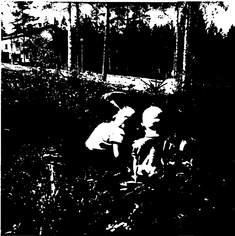
Valimonmäen lapsia marjastamassa asuinalueella 1950-luvulla.

“Lapsethan teki silloin hirmusesti töitä, että senkin muistan, kun myö oltiin Mattilanpellolla. --- Ja siinä oli semmonen Mattilankartano. Siellä oli isot pellot, missä oli perunaa ja sipulia, juurikasvia, nii sitten me Rautpohjan lapset kuule, niin kesällä oltiin siellä töissä. Ja tuota perunankaivuussa oltiin ja sitten sipulia laittamassa ja oltiin harventamassa. Mekin oltiin veijen kanssa siellä monena kesänä ja ihan lapsena. Mekin niin paljon oltiin siellä työssä, että myö hankittiin mejän perheelle koko talven perunat.” (N931.)