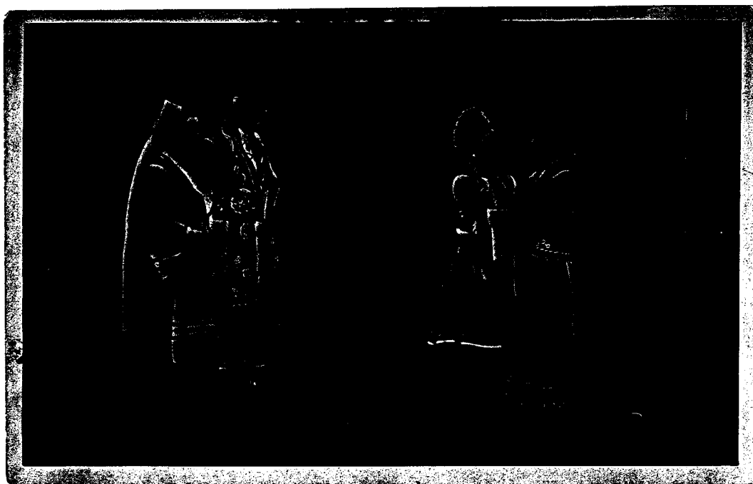
Kylänheittiö -näytelmä 1950-luvulla.

Teatterin esitysrepertuaari oli varsin laaja ulottuen tunnetuista suomalaisista tuntemattomampiin ulkomaalaisiin näytelmiin, farsseista ja draamoista laulunäytelmiin, kuten esim. “Papin perhe”, “Kylän heittiö”, “Hevospaimen”, “Kylä vuorten takana”, ja “Kaksikymmentäneljä tulipunaista ruusua” (M224, N525). Samana vuonna saattoi olla useitakin ensi-iltoja. Koko toiminta-aikanaan teatteri tuotti yli 20 kokoillan näytelmää (Jokinen 1988b: 259). Tehtaan teatteri esitti samoja näytelmiä, joita näyteltiin suurilla lavoilla kuten Kansallisteatterissa, mutta se uskalsi ottaa ohjelmistonsa myös tuntemattomampiakin kappaleita.