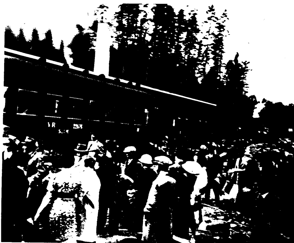
Asevarikko 1:n henkilökuntaa perheenjäsenineen Valtion Tykkitehtaan ratapihalla Jyväskylässä kesäkuussa 1938.

Valtion Tykkitehdas aloitti toimintansa tammikuussa 1938 Helsingin Katajanokalla. Sen perustan muodostivat Asevarikko 1:n Korjauspajat, jotka jo olivat perehtyneet tykkien korjaukseen sekä huoltoon ja kykenivät siten myös niiden kehittämiseen ja valmistukseen. Tykkitehdas siirrettiin kuitenkin strategisten syiden takia Keski-Suomeen, Jyväskylään kesällä 1938, jolloin tehtaan mukana muutti suurin osa Asevarikko 1:n henkilökuntaa perheineen. (Jokinen 1988b: 26-27, 32.)