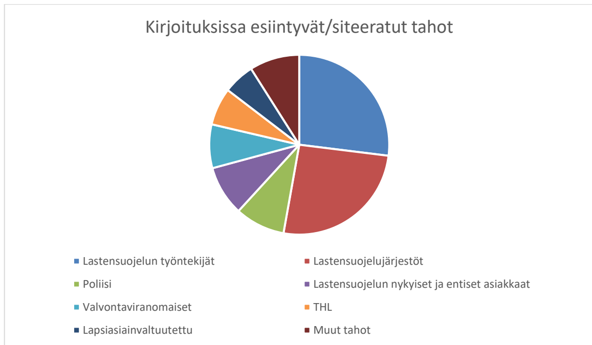
Kuvio 1: Kirjoituksissa esiintyvät/siteeratut tahot

Kaikkein eniten Helsingin Sanomien teksteissä esiintyivät lastensuojelun sosiaalityön kentän työntekijät, 24 kirjoituksessa. Seuraavaksi eniten esiintyivät lastensuojelujärjestöt 23 kirjoituksessa ja kolmanneksi useimmin poliisin edustajat ja lastensuojelun entiset ja nykyiset asiakkaat kahdeksassa tekstissä. (Kuvio 1)