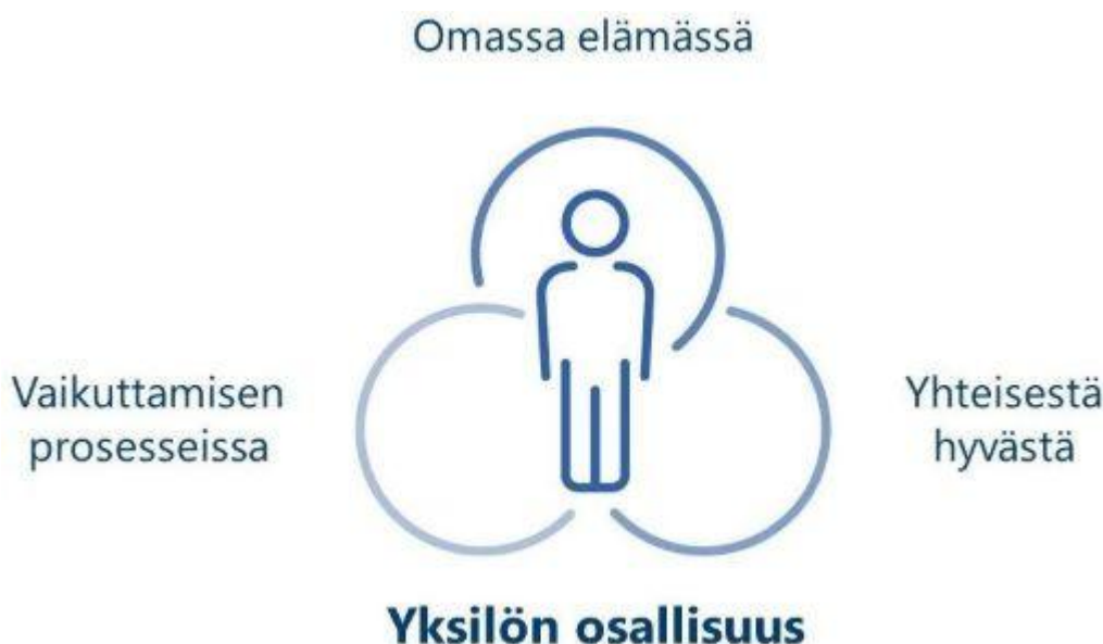
KUVIO 1 Yksilön osallisuus (Työterveyslaitos 2022)

Osallisuus edellyttää sitoutumista ja onnistuakseen se vaatii luottamusta, tiivistä vuorovaikutusta ja kuulluksi tulemistä. Osallisuuteen sisältyy myös vastuunotto henkilökohtaisesti omista asioistaan. (Laitinen & Niskala 2013, 13.) Lisäksi osallisuus pitää sisällään Valkama & Raison (2013, 92) mukaan ajatuksen siitä, että palvelunkäyttäjä voi vaikuttaa toimintaan tai palveluprosesseihin. Työterveyslaitoksen (2022) mukaan osallisuus yksilön elämässä on osallistumista, kuulumista ja vaikuttamista omaan elämään, yhteisiin asioihin ja mahdollisuuksiin. Osallisuuden kokemukset rakentuvat yhteistyössä ihmisten kesken. (Kuvio 1)