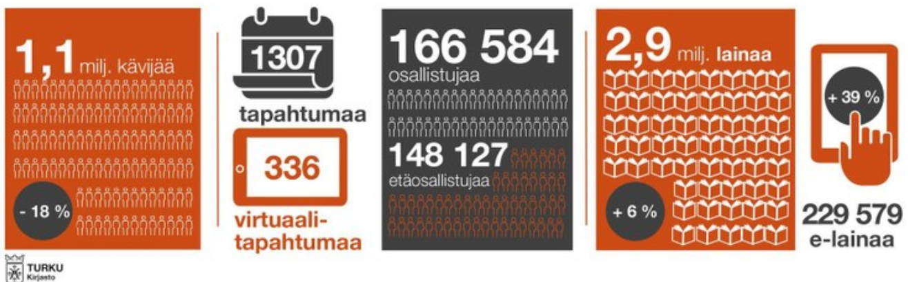
Kuva 3. Turun kaupunginkirjastossa tehtiin vuoden 2021 aikana puoli miljoonaa varausta, mikä on kirjaston kaikkien aikojen varausennätys. (Lähde: Turun kaupunginkirjasto 2022.)

Myös kirjaston merkitys on korostunut poikkeusoloissa kirjojen ja lukemisen merkityksen kasvaessa. Esimerkiksi Turun kaupunginkirjastossa tehtiin vuoden 2021 aikana puoli miljoonaa varausta, mikä on kirjaston kaikkien aikojen varausennätys! Myös e-aineistojen lainamäärä on ollut poikkeusolojen aikana kasvussa. Turun kaupunginkirjaston varauspalvelun käyttö kasvoi vuonna 2021 36,2 %, ja e-aineistojen lainaaminen kasvoi 38,5 % vuoteen 2020 verrattuna. Myös kirjaston järjestämien, useimmiten etänä virtuaalisesti toteutettujen tapahtumien osallistujamäärä nousi 38,4 % vuodesta 2020. Lukutaidon kehittämisen ja kirjallisuusharrastuksen edistämisen lisäksi kirjaston rooli kiertotalouden edistäjänä on noussut yhdeksi kirjaston tärkeimmistä teemoista. (Ks. kuva 3) (Turun kaupunginkirjasto 2022.)