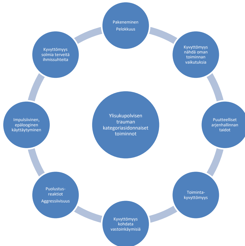
Kuvio 2 Ylisukupolvisen trauman kategoriasidonnaiset toiminnot

Sosiaalityöntekijät yhdistivät ylisukupolvisen trauman kategoriasidonnaisiksi toiminnoiksi impulsiivisen ja epäloogisen käyttäytymisen, sekä puolustusreaktiot ja aggressiivisuuden. Sosiaalityöntekijät kertoivat, että epälooginen käyttäytyminen, voimakkaat aallonpohjat ja voimakkaat reaktiot odottamattomissa tilanteissa, saavat heissä heräämään ajatuksen traumakäyttäytymisestä. Lisäksi pakenemisreaktiot, pelokkuus ja kyvyttömyys kohdata vastoinkäymisiä, kertoo usein sosiaalityöntekijöille, että he ovat triggeröineet jotain sellaista, joka aktivoi trauman sävyttämän toiminnan. Edellä kuvattuja toimintoja yhdistää suurelleisyyttä, sekä isot ja voimakkaat tunteet