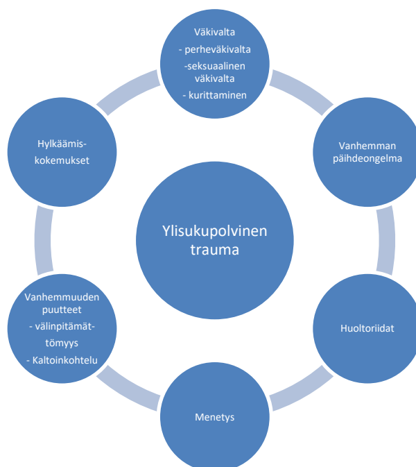
Kuvio 1 Ylisukupolvisen trauman kategoriakokoelma

Kategoriakokoelman kategorioiden kohdalla on tiedostettava, että kategoriat eivät ole tarkkarajaisia, vaan ne limittyvät toisiinsa. Esimerkiksi huoltoriitaa edeltävä avioero voi olla myös hylkäämiskokemus ja jopa syy huoltoriidalle. Tätä limittymistä kuvaa liitteessä 3 esitelty kategoriakokoelman muodostumista kuvaava taulukko, jossa samat tekstinäytteet muodostavan väkivallan ja vanhemman päihdeongelman kategorian. Kategorioiden muodostamisen ei tarvitse sulkea pois kategorioiden yhtymäkohtia. Kategoriakokoelma ei ole tarkoitus nostaa esiin yhtä tarkkarajaista ja yksiselitteistä vastausta, vaan se on muodostunut haastattelutilanteissa esiin nousseista kategorioista. Kategoriakokoelma todentaa, että ylisukupolvisen trauman ilmiö on olemassa ja läsnä systemisen lastensuojelun kontekstissa ja lastensuojelun arjen työssä.