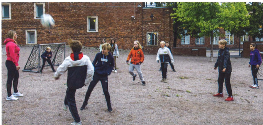
Katajanokan ala-asteen oppilaita pihafudiksen parissa.

Autonomisesti motivoituneet yksilöt paneutuvat liikuntaan syvämmällä ja perusteellisemmin.