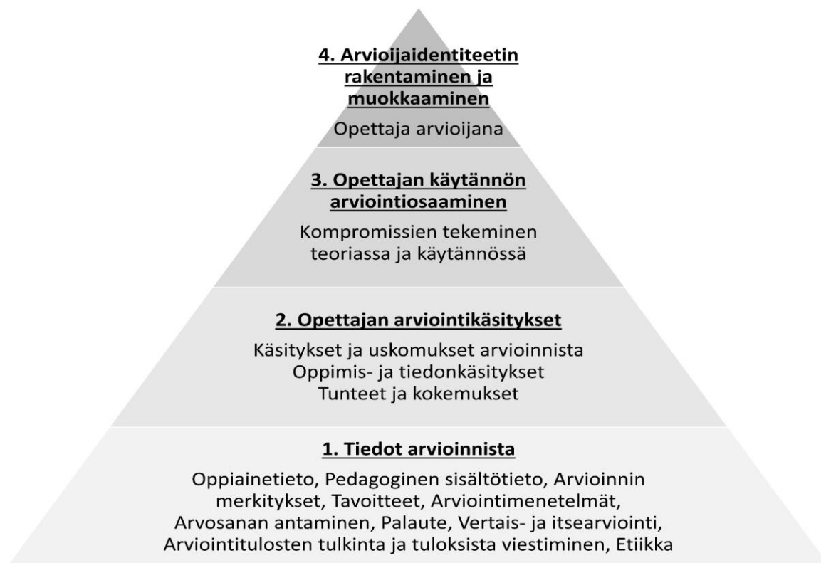
Kuvio 1: Opettajan arviointiosaamisen osa-alueet (Xu & Brown, 2016)

Opettajien arviointiosaaminen (assessment literacy) on moniulotteinen kokonaisuus. Xun ja Brownin (2016) mukaan sen perustana ovat tiedot arvioinnin menetelmistä, merkityksistä ja etiikasta (Kuva 1). Näiden päälle rakentuvat opettajan oppimiseen ja arviointiin liittyvät käsitykset, uskomukset ja tunteet. Arviointiosaamisen kolmas taso kuvaa käytännön arviointiosaamista, mikä tarkoittaa kompromissien tekemistä sekä teoriassa että käytännössä omien uskomusten, käytännön tilanteiden ja virallisten vaatimusten välillä. Arviointiosaamisen neljäs ja korkein taso on oman arvioijaidentiteetin tiedostamista ja rakentamista. Arvioijaidentiteetti ei ole luonteeltaan pysyvä, vaan se vaatii jatkuvaa päivittämistä, erityisesti silloin, kun esimerkiksi opetussuunnitelmassa tai pedagogiikassa tapahtuu muutoksia.