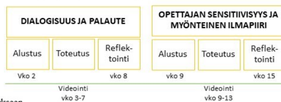
Kuvio 2. Esimerkkejä VOPA-toimintamallin soveltamisesta opettajankoulutukseen