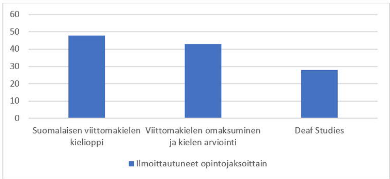
Kuvio 1. Ilmoittautuneet opintojaksoittain.

toteuttaa kahtena kaksipäiväisenä lähiopetustapaamisena. Yksi opintojakso sisälsi näin ollen kaksikymmentä tuntia lähiopetusta. Lisäksi opintojaksojen sisältöihin kuului itsenäistä työskentelyä oppi- ja arviointimateriaalien parissa.