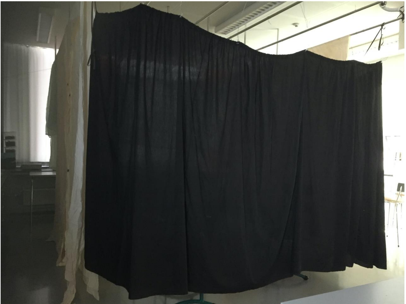
Kuva 1: Kuvataideluokkaan rakennettu kuuntelutila ulkoa päin.

Porvoon Pääskytien koulu, Kuvataideluokka 17.05.2019.