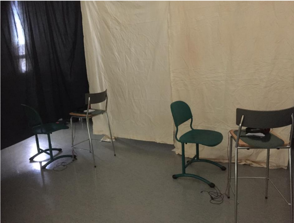
Kuva 2: Kuuntelupaikat Kesälaiturilla - ja Sade -teosten kuunteluun.