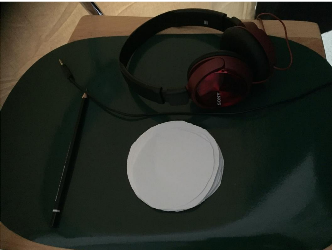
Kuva 3: Talvivirta -kuuntelun tarvikkeet eli korvakuulokkeet, kynä ja muistiinpanolaput.