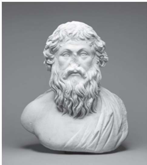
”Portrait of a philosopher” (J. Paul Getty -museo, 71.AA.284), 5. vuosisata jaa.

[...] ylös kiipeäminen ja ylhäällä avautuvien näkymien katseleminen kuvaa sielun kohoamista ajatuksella tavoitettavaan maailmaan [...]. (Platon, Valtio 517d, suom. Itkonen-Kaila)