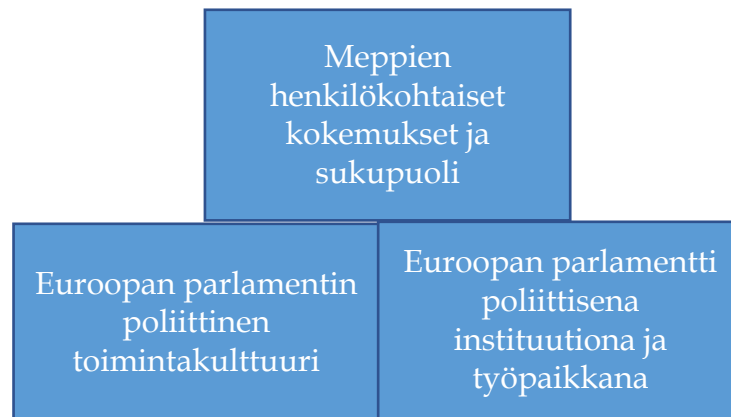
KUVIO 1 Koodien avulla muodostetut teemat

Aineistosta poimitut koodit helpottavat teemoittelun tekemistä ja tukevat analyysin tekemistä. Koodien avulla muodostin kolme teemaa, jotka on merkitty alla olevaan kaavioon.